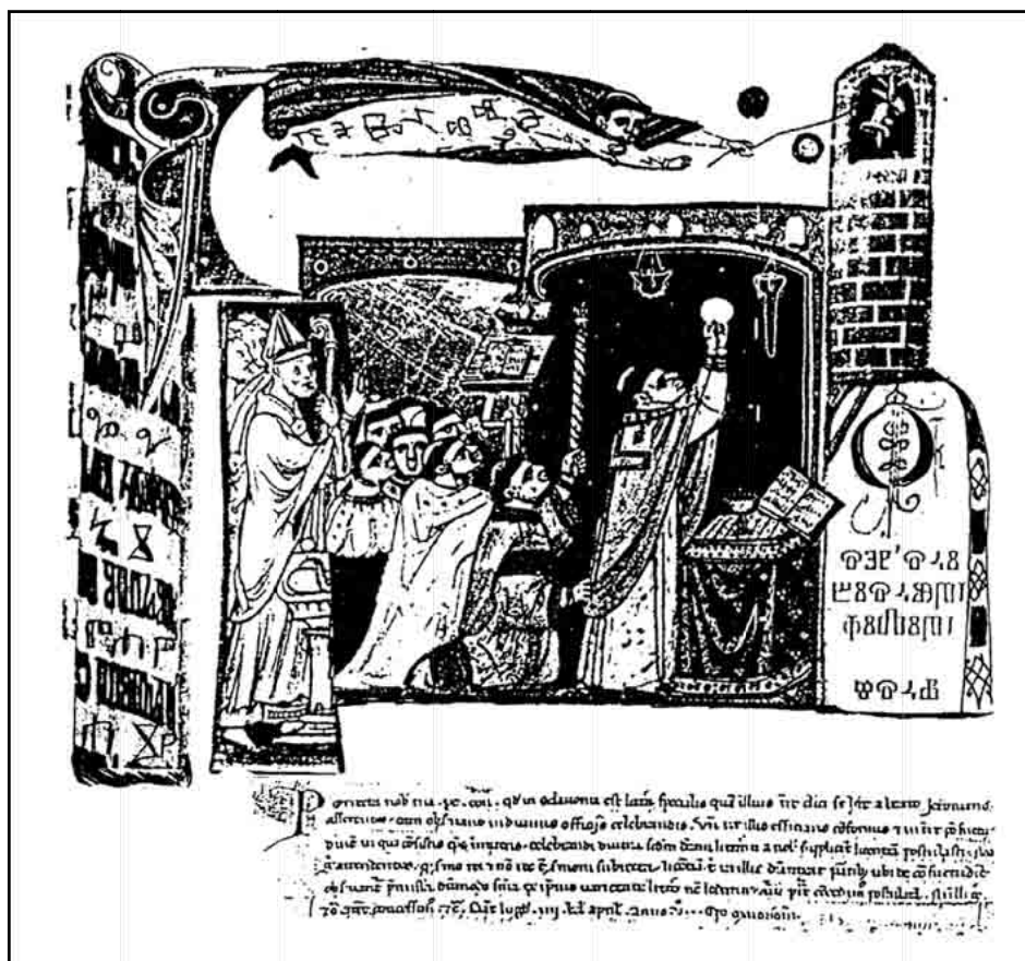
Sl. 2. Pismo pape Inocenta IV. senjskom biskupu Filipu, Vjera Reiser 1988. (prema M. BOGOVIĆ, 1998a, VI)

prilike na hrvatskim prostorima u 13. st., 45 M. Bogović drži kako Filipu osobno dana papinska povlastica nije bila samo puko poštivanje uobičajenih kanonskih normi davanja papinskog dopuštenja biskupu za uporabu glagoljice i staroslavenskog jezika u liturgiji u njegovoj biskupiji, nego je ona istodobno bila i dio nove misijske strategije učvršćivanja pravovjerja i širenja katoličanstva na slavenskim prostorima. 46 A tu novu misijsku strategiju trebalo