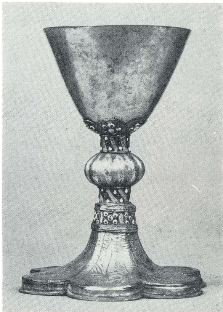
6. Gotički kalež iz 14. st. Muzej za primijenjenu umjetnost u Beču