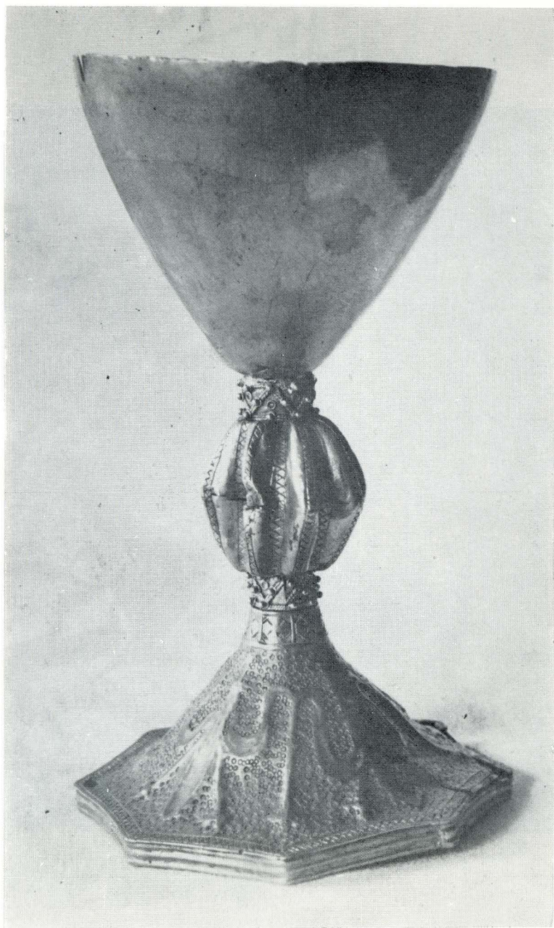
7. Kalež iz Vodenice. Muzej za umjetnost i obrt, Zagreb