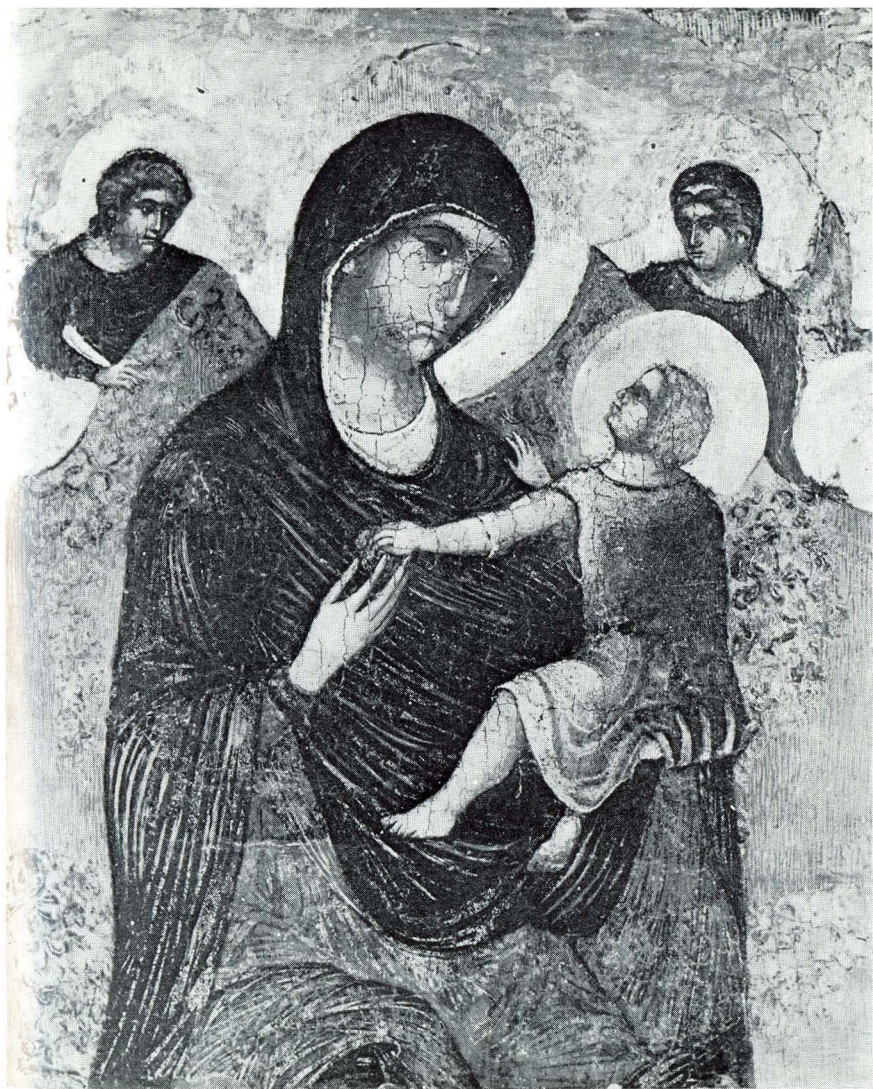
1. Radionica Paola Veneziana. Gospa sa sinom i andelima. Lukovičeva zbirka u Prčanju