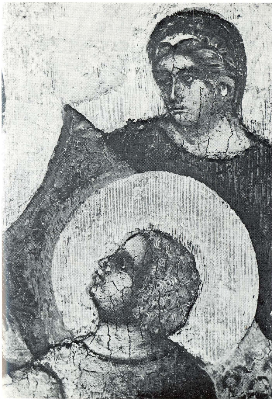
3. Radionica Paola Veneziana. Gospa sa sinom i anđelima (detalj). Lukovičeva zbirka u Prčanju