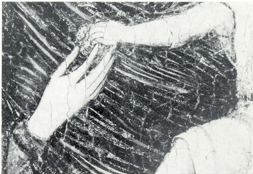
5. Radionica Paola Veneziana. Gospa sa sinom i anđelima (detalj). Lukovićeva zbirka u Prčanju