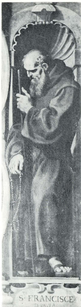
15. Antonio Carneo, sv. Franjo Paulski. Franjevački samostan na Orebićima