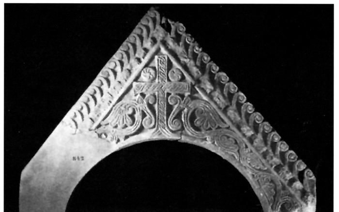
3. Zabat oltarne ograde iz Biskupije, 11. st.

Tražeci sličnost s ukrasima na ciboriju zaustavit ćemo se na primjercima onodobne skulpture u Zadru. U zadarskome arheološkom muzeju čuva se zabat oltarne ograde, na kojem je isklesan motiv biljne vijuge vrlo slično komponiran i isklesan kao tropruti biljni motivi na ciboriju. Nad njom je također bio vijenac ažuriranih lukova koji su, na žalost, odlomljeni. Obradba je nešto grublja nego na ciboriju. Isti se takav zabat nalazi sekundarno ugrađen nad sporednim ulaznim vratima župne crkve u Sukošanu u zadarskoj okolici, što upozorava na to da je donesen iz Zadra i da je s onim u arheološkom muzeju pripadao oltarnoj ogradi neke trobrodne crkve (najvjerojatnije zadarske katedrale 21 ).