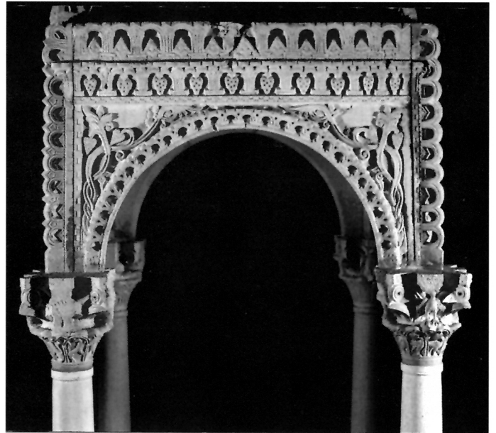
2. Stranica rekonstruiranog ciborija iz Biskupije, 11. st., MHAS, Split

isklesani ažurirani lukovi. Stranice su ukvirene uskim frizom s motivom šahovnice. Trokutaste površine stranica između luka i vijenca ispunjene su biljnim prepletom, svaka stranica ima različit motiv simetrično komponiran. Na trima stranama biljne su vijuge isklesane poput tročlanih vrpce, a na jednoj su vijuge u obliku dvočlanih vrpce. Taj isklesani ornament vrlo je istaknut u odnosu na pozadinu, po čemu se mnogo razlikuje od obrade reljefa na predromaničkome crkvenom namještaju, gdje se vrpce i biljne vijuge jedva izdižu od pozadine. Kapiteli su također bogato ukrašeni. Na njima su isklesani i mali životinjski likovi. Na jednom se ističu orlovi izradeni gotovo trodimenzionalno, što je postignuto ažuriranjem dijelova kapitela. I na drugim se kapitelima ističe tehnika na proboj ("a jour"). Krov je ciborija četverostran, a krovne su ploče ukrašene reljefnim ljuskama, što također potvrđuje da je klesar težio što bogatijem ukrašavanju.