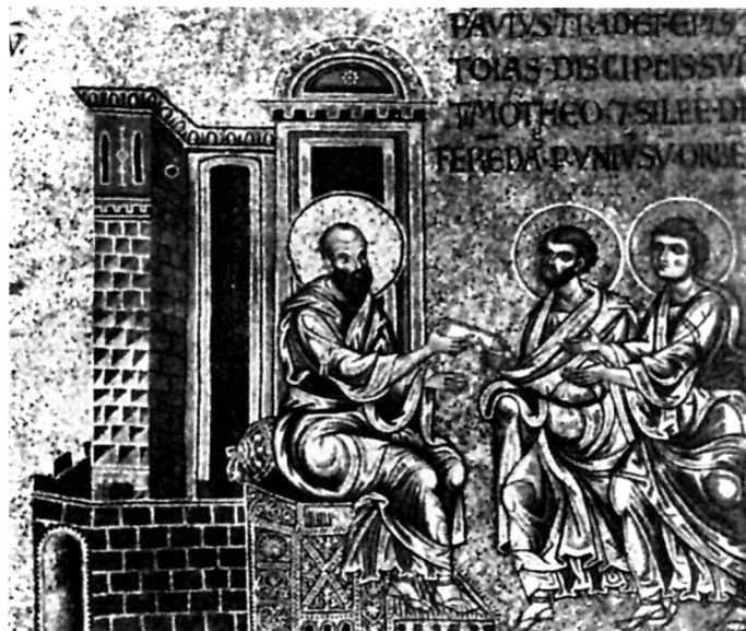
2. Sv. Timotej i Sila primaju iz ruku sv. Pavla svitak s poslanicama, mozaik iz XII. st., katedrala u Monrealu