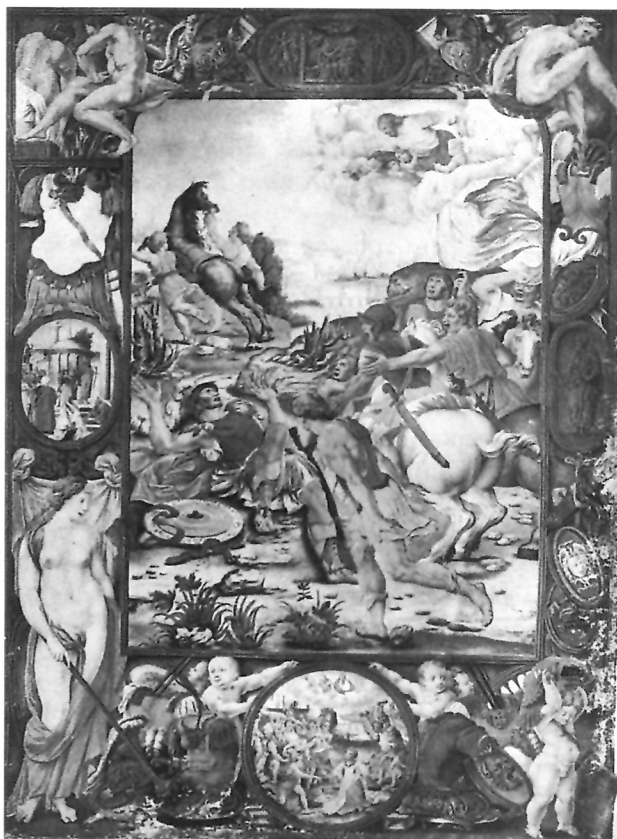
1. Obraćenje sv. Pavla, fol. 8, Komentar poslanice sv. Pavla, Soane's Museum, London