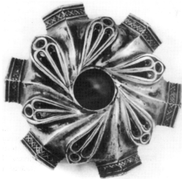
3. Nodus Kaleža iz Oštarija