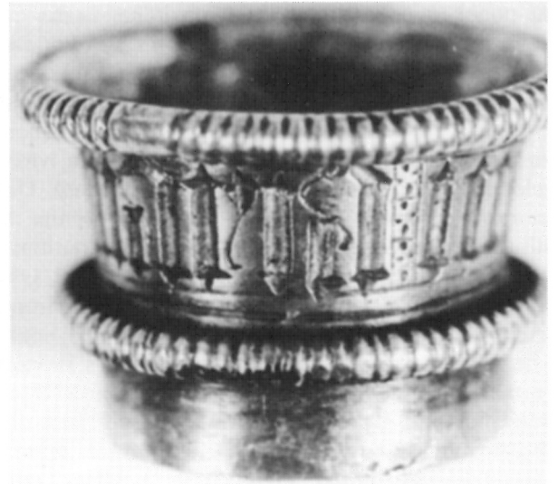
4. Prsten iznad nodusa s tekstem MARIA MATER C STI