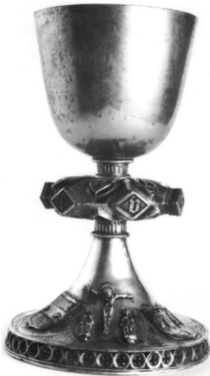
1. Kasnogotički kalež iz Oštarija, Hrvatski povijesni muzej, Zagreb

Na impresivnom veoma spljoštenom nodusu (sl. 3) strši šest rombanih ispupčenja. Na svakome je po jedno slovo izvedeno goticom u plitkom reljefu: I(L), H(B), E, C(S), U(V), S. Iako postoje različite inačice čitanja, jer, kako je poznato, natpis može biti oznaka donatora, a može biti i dogamatskog ili zavjetnog karaktera, tu je najvjerojatnije riječ o uobičajenu spominjanju Kristova imena "IHESUS", koje se, uz Marijino, često pojavljuje na takvoj vrsti predmeta 3 . Postoji mogućnost i za neke druge prijevode koji nastaju igrom i kombinatorikom navedenih slova, ali koji, po svemu sudeći, nisu relevantni za naš primjer 4 . Osim te, položajem, veličinom i vrstom pisma istaknute tekstovne poruke, vrlo su važni