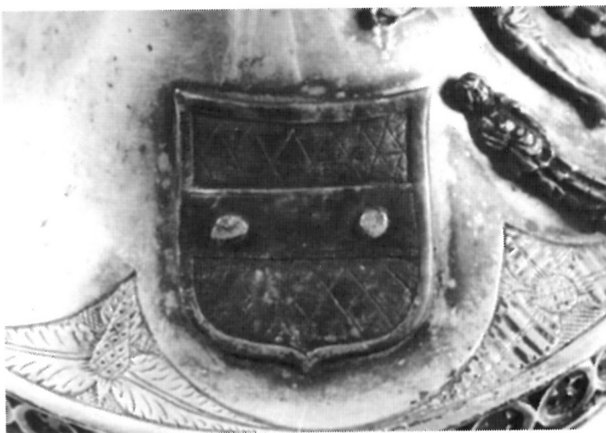
6. Grb na podnožju Kaleža, lijevi