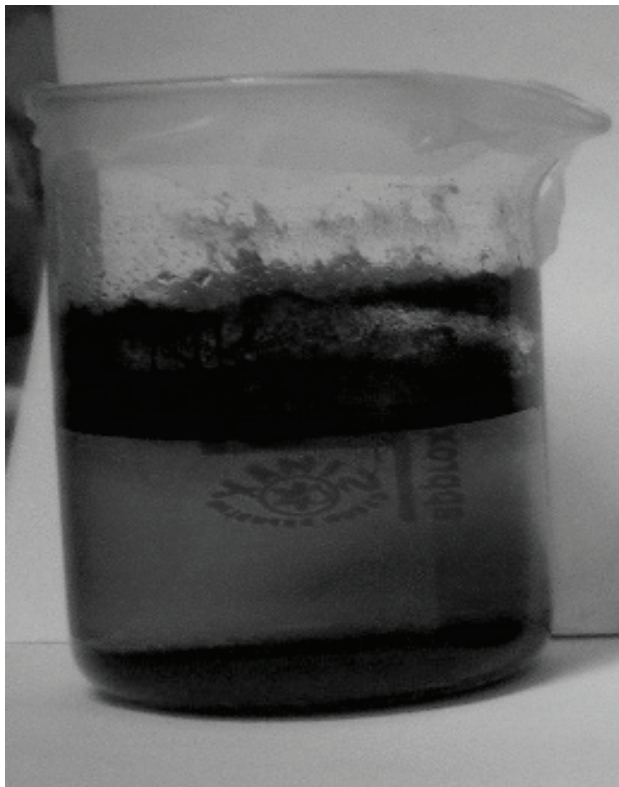
Slika 3. Uzorak obraden željezovim(III) kloridom koncentracije 0,044 mol/L pri pH=2

Nakon što su uzorci odstajali do idućeg radnog dana, kod nekih je došlo do jasnog odjeljivanja faza kao npr. u eksperimentu koji je proveden uz koncentraciju željezovog(III) klorida od 0,044 mol/L i pH=2 (Slika 3).