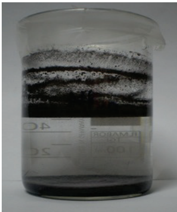
Slika 1. Uzorak obraden aluminijevom(III) sulfatom koncentracije 0,011 mol/L pri pH=4,5

Nakon što su uzorci odstajali do idućeg radnog dana, kod nekih je došlo do jasnog odjeljivanja faza kao npr. u eksperimentu koji je proveden uz koncentraciju aluminijevog(III) sulfata od 0,011 mol/L i pH 4,5-vrijednosti 4,5. (Slika 1).