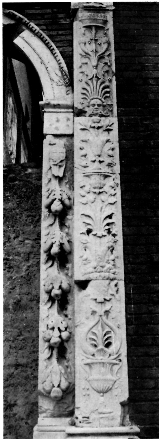
3 Duknovićev pomoćnik, Južni dovratnici franjevačkog samostana u Ankoni.

zatim pažljivo obnovljena. Tragovi rušenja i obnove jasno se vide i na spomeniku. U knjižnici Danni di guerra e providenze per le antichità i monumenti e l'arte objavljenoj u Jakinu 1946, na str. 72. piše da je bivši samostan pretvoren zatim u knjižnicu i muzej bio bombardiran od travnja do srpnja 1945, ali se ne spominju Duknovićeva vrata. Ne spominje ih ni L. Serra, L'arte nelle Marche II, Periodo del Rinascimento , Rim 1934.