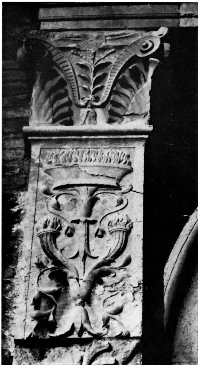
5 Ivan Duknović, Gornji dio sjevernog dovratnika franjevačkog samostana u Ankoni

i Andrijom Bregnom, 11 a vide se na njegovu zdcenu Matije Korvina u Višegradu, 12 na Gianellijevu spomeniku u Jakinu 13 i na reljefima u Trogiru. 14 To su vitke vaze, rogovi obilja, uspravne groteske koje niču iz