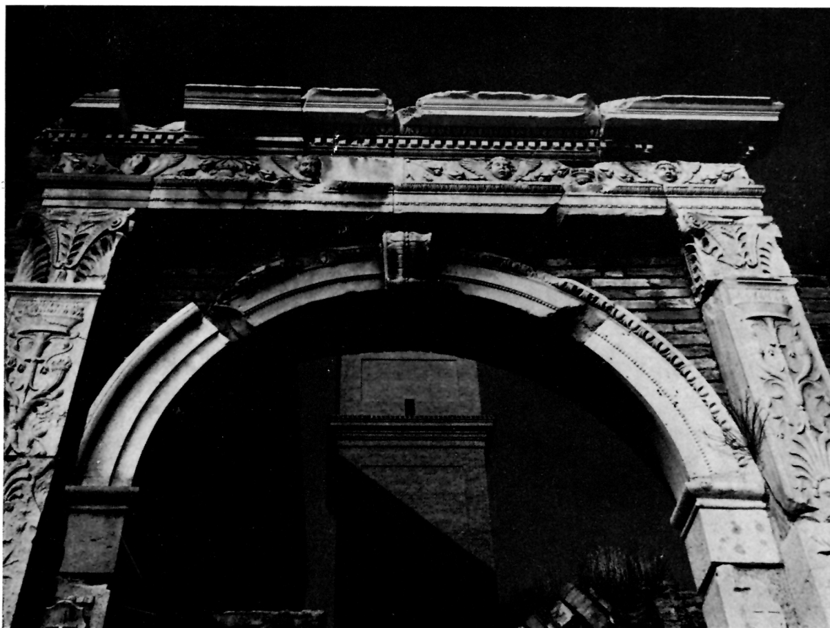
4 Ivan Duknović, Gornji dio vrata franjevačkog samostana u Ankoni

nejednakih sastavaka i završavaju palmetastim glavica- ma na kojima je položen dvostruki grednjak. Donju mu traku uzdužno presijeca niz astragala, a gornju iznad re- da ovula popunjavaju izmjenično složene tri vaze i četiri anđeoske glave postavljene nad vijencima obješenim iz- nad vaza. Sve završava jakim nadvratnikom izbočenim prema vani u slojevitom redanju traka pojačanih trak- om zubaca i ovula. Tako se sav ukras podređuje ulozi ovog okvira koji određuje vrata na pročelju zgrade. Za- to mu je i raščlamba tako statička od osnovnog nacрта do obrade pojedinosti u strogo logičnom i vrlo čitkom sustavu. Jednako je odmjeren i površinski ukras, pla- stički vrlo plitak, predočen je više grafički negoli re- ljefno, s time da se na dovratnicima ostvaruje uspinju- ći njegov gusti rast, a na svemu nadvratniku nagla- šena je vodoravna opuštenost.