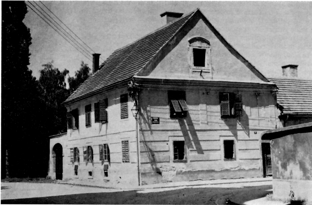
VARAŽDIN, Padovčeva 8.

Svakako najveće građevinsko i arhitektonsko ostvarenje Jacoba Erbera (koje nam je do danas poznato iz arhivskih dokumenata) i koje nam je i danas sačuvano, iako u nešto aptiranom obliku, jest novogradnja Xenodochija u Nazorovoj ulici br. 26.