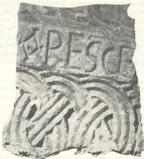
16. Ston, ulomak s natpisom sv. Marije nađen kraj Gospe u Lužinama

dariju, donešeni su s ovog mjesta i jasno pokazuju da su pripadali crkvenom kamenom namještaju neke starije crkve u tom predjelu. Osobito se ističu dvije kamene uresne ploče. Jedna je dužine: 88 cm, širine: 72 cm, debljine: 7 cm, sa osobito istaknutim motivom kod pleterne ornamentike tz. klasičnim »okom« tj. kuglicom u zavijucima troprutaste pletenice, koja u pravilnim plitkim kružnim polji-