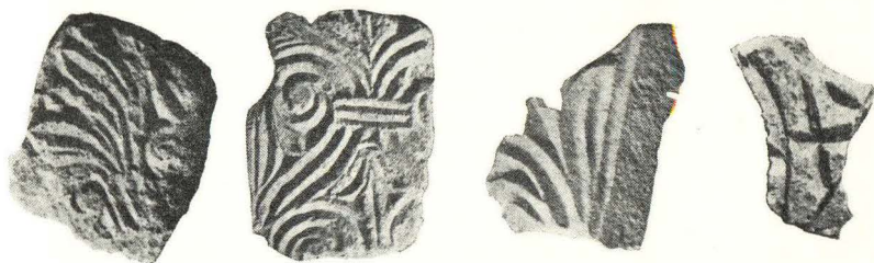
18. Ston, ulomci nađeni kraj Gospe u Lužinama

zidu ostatak zidne fresko slike, sad pohranjen u Dubrovniku. Unutar same crkvene građevine nađen je i starokršćanski kameni sarkofag pokriven poklopcem u obliku sedlastog krova sa timpanimazabatima — u užim pročeljima i akroterijima na uglovima. Na dužem južnom licu arke uklesan je ideogram Krista u obliku profiliranog kružnog okvira, a u sredini je križ. To je tzv. crux coronata koji alegorično prikazuje Krista. 27) Sličan oblik križa nalazimo na jednom sarkofagu u Slanome. Vjerojatno i ovaj sarkofag nađen na lokalitetu Gorica pripada onoj grupi sarkofaga nađenih u Slanome te ga analogijom možemo smjestiti pri kraju V ili početkom VI stoljeća n. e. uzevši u obzir okolnost, da jedan sarkofag u Slanome nosi latinski natpis i datira ga se godinom 462. 28) Općenito uzevši ovi sarkofazi u Dalmaciji pripadaju tzv. ravenskoj grupi koja je najviše