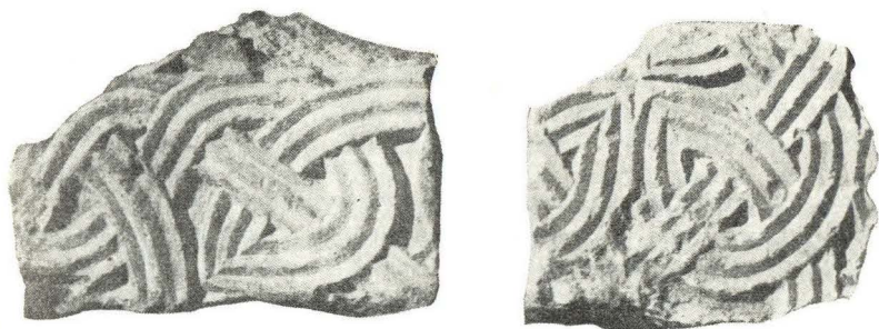
17. Ston, ulomci nađeni kraj Gospe u Lužinama

u zavijucima i u središtu krugova, a u poljima, koje zatvaraju krugovi, urezani su, u plitkom reljefu, četiri troprutasta ljiljana, koji se dodiruju s točkom sred kruga. U slobodnom prostoru izvan krugova stiliziran je trolist.