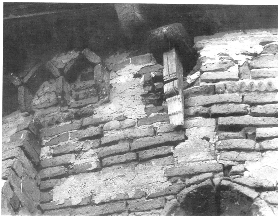
Bapska, detalj arhitektonske dekoracije (1968.)

opeka. Naravno, postoje i maštovite, polikromne kombinacije opeke i kamena. Dekorativni repertoar mogao bi se nazvati tipičnim za područje graditeljstva u opeci, no valja naglasiti njegovu raznolikost. U smislu potkrovnih vijenaca, koji su najvažniji dekorativni motiv ove arhitekture, pa tako i gornjih završetaka plitkih zidnih niša ili ukrašavanja zabatnih površina, nailazimo na nizove arkadica, ali i na trokutasti motiv kakav se javlja u Bapskoj, kao i na varijantu ravnog istaknutog poteza na konzolama. 13 Dakle, friz u šilj spojenih elemenata (bilo opeka bilo komada kamena) smatra se tipičnim za to područje (Friesland: Eestrum / opeka, Swichum / opeka, Jorwerd-toranj / kamen i opeka; na brodu i apsidi javlja se ravni potez na