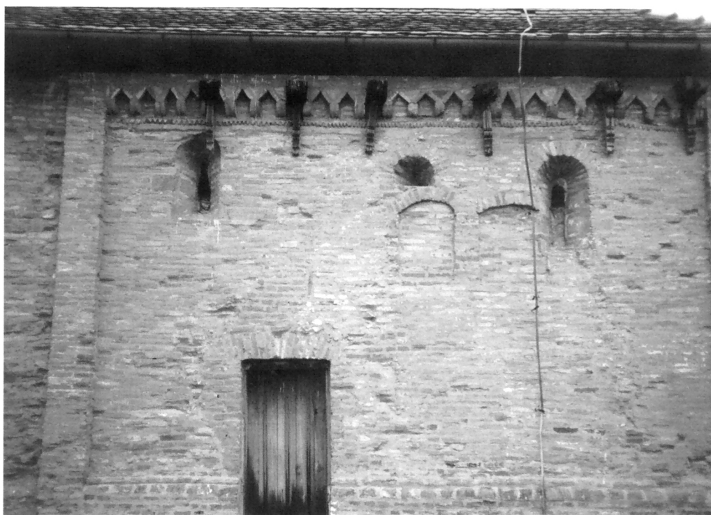
Bapska, romanička faza južnog zida (2004.)