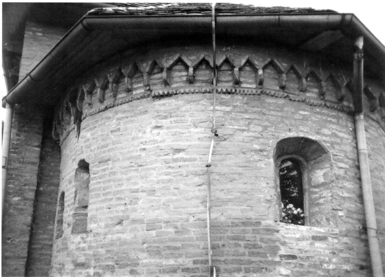
Bapska, apsida (2004.)