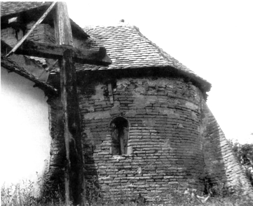
Bapska, romanička apside (1968.)

oslobodenju, dakle oko 1700. ili nedugo nakon te godine. Ovdje, naime, nije trebalo vršiti repopulaciju jer su se u dolinama Fruške gore očuvali stari stanovnici. Tako je nakon nekoliko desetljeća crkvice kao poluruševina ponovo preuzela svoju vjekovnu funkciju. Kao popularno prošteništa postala je ponovo premalena, pa je u 19. stoljeću dodan još jedna prostorni element – lopica. 8