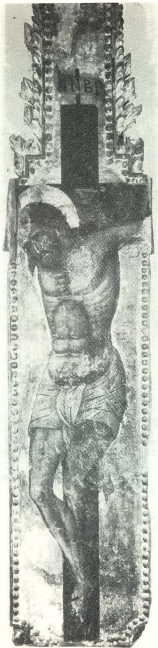
36. Italokretski slikar, Raspelo. Korčula, Riznica stolne crkve