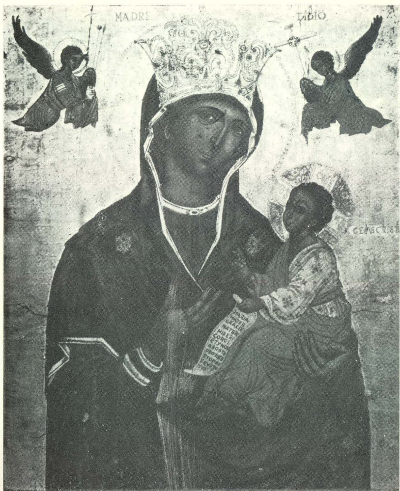
40. K. Zane, Bogorodica s djetetom. Prčanj, župna crkva