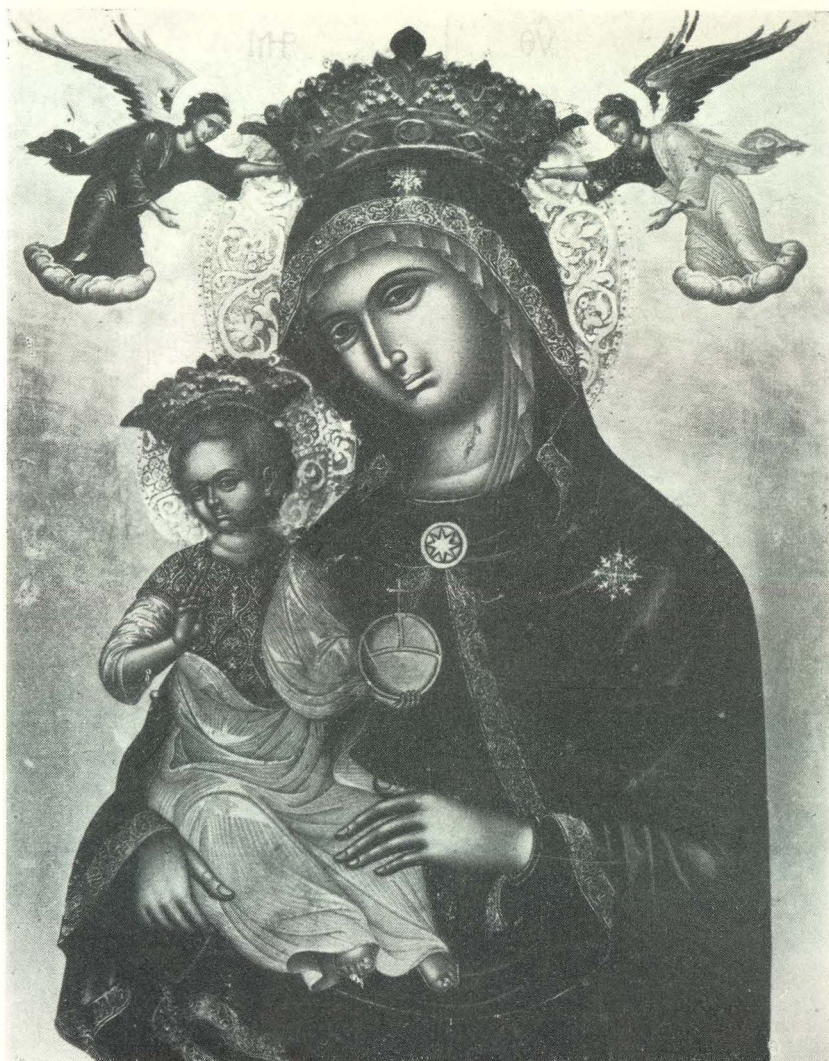
39. E. Zane, Bogorodica s djetetom. Dobrota, crkva sv. Stasija