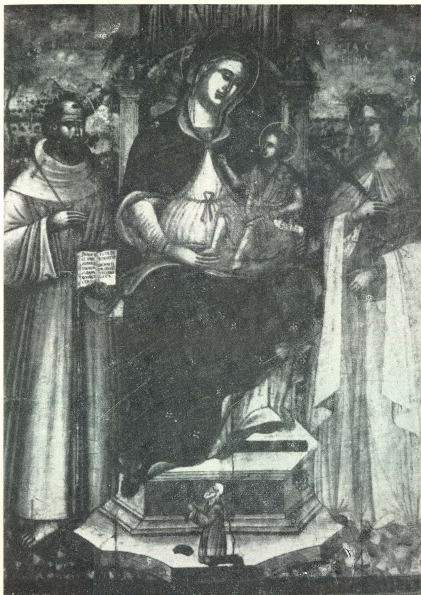
38. D. Bizamano, Bogorodica sa svecima i donatorom. Bari, Pinacoteca provinciale