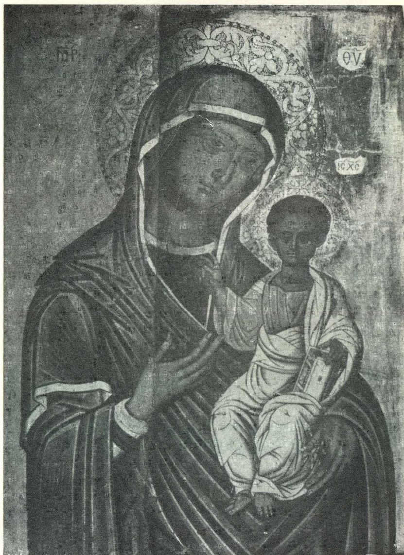
41. K. Zane, Bogorodica s djetetom. Split, privatna vlasnost