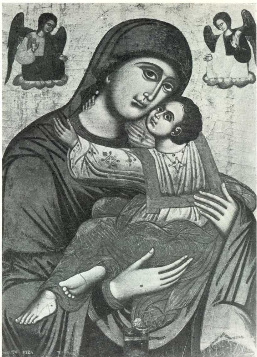
37. D. Bizamano, Bogorodica s djetetom. Dubrovnik, crkva dominikanaca