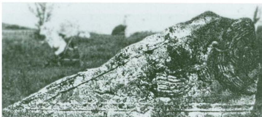
Tabla / Plate 4