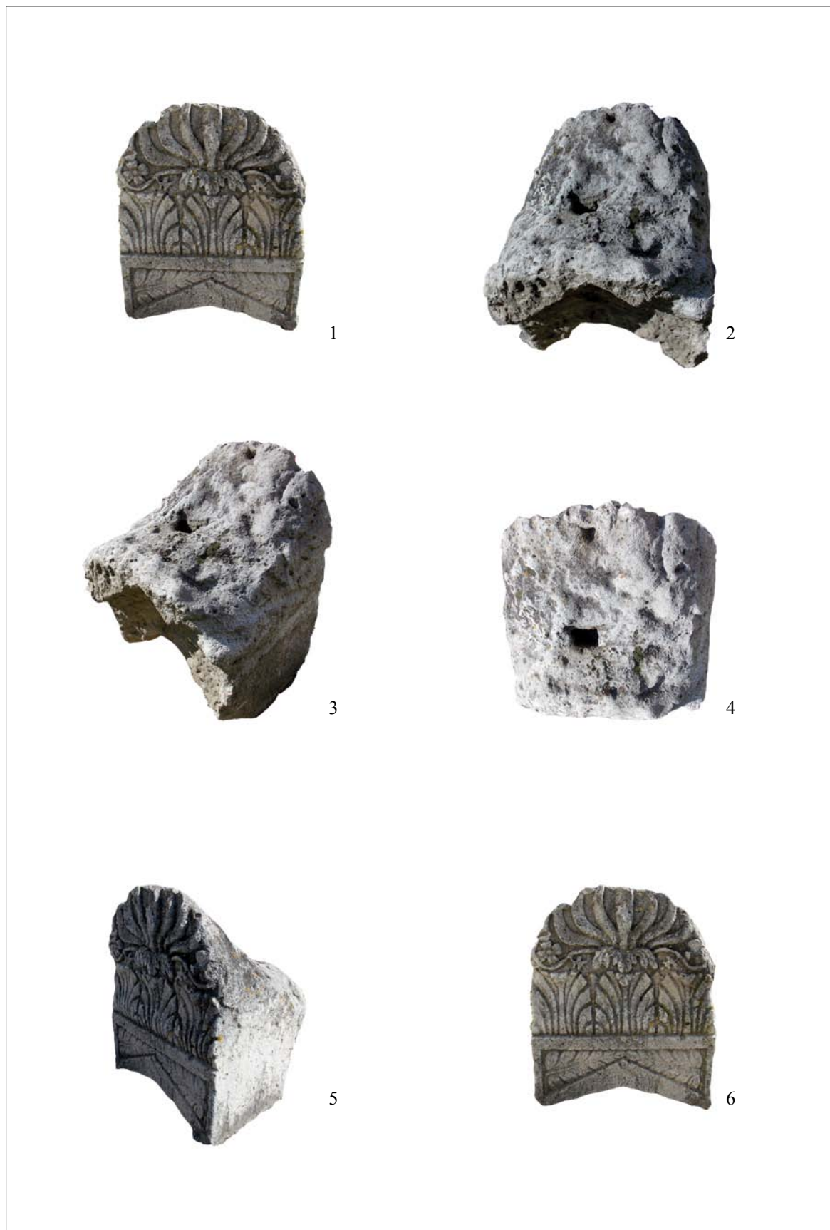
Tabla / Plate 2