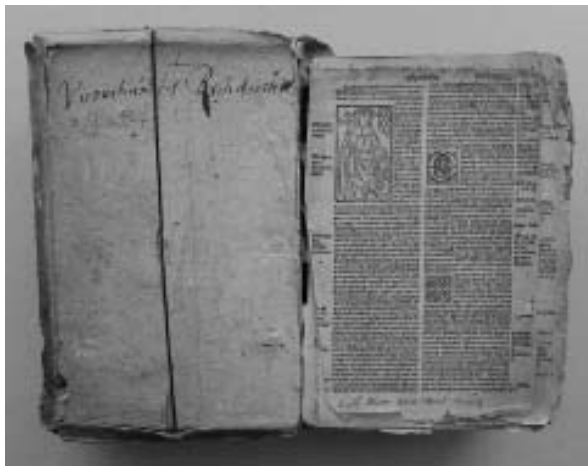
Sl. 1– [Biblia cum summariorum apparatu pleno quadriplicique repertorio insignita ...]. – [Lugduni ? : s. n., s. A.], (Virovitica: R IV-m8 o -7)