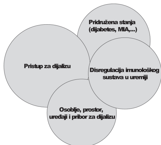
Sl. 1. Patogenetski i epidemiološki čimbenici vezani uz infekcije na dijalizi (adaptirano prema ref. 4 i 5)