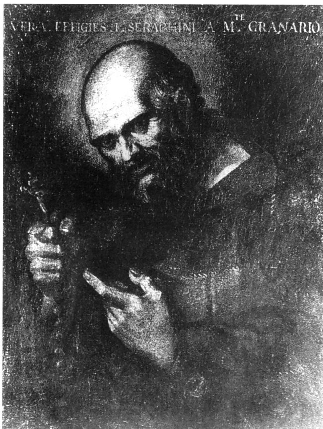
Pietro Gaia, Sv. Serafin od Montegranara , samostan kapucina, Ascoli Piceno

VIII. uvrstio je Serafina u blažene, a trideset i osam godina poslije, 1767. godine, papa Klement XIII. uvrstio ga je u svece. 5