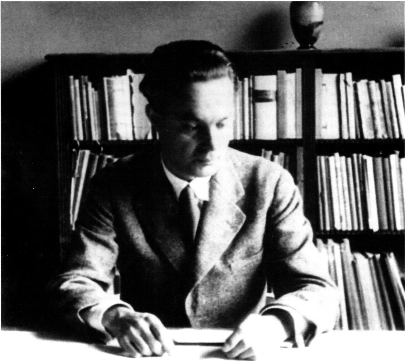
Drago Ibler, osnivač i profesor Škole za arhitekturu na ALU