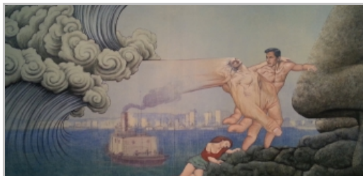
Jim Shaw, The Deluge , 2014, akrilik na platnu, 152 x 233 cm

Na drugom katu muzeja izloženi su radovi iz Shawove privatne kolekcije. Slikarski amaterski radovi nepoznatih autora kupovanih na buvljacima, bizarne religijske ilustracije i tekstovi, naslovnice stripova i konspiracijski časopisi, pružaju nam uvid u izvore umjetnikove inspiracije i otkrivaju korijene njegovog širokog i inventivnog opusa. Istovremeno, taj visoko kalorični ikonografski miks, predstavlja i sliku podsvijesti američke nacije.