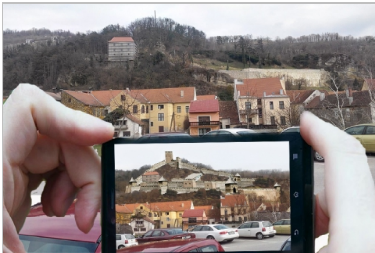
Sl. 1. Prijedlog za idejno rješenje 3D holograma - pogled na stari grad Krapina, Croatia - prema arheološkim poznatim istraživanjima, crtežima i pretpostavkama, autor: Robert Kuhar, 2014