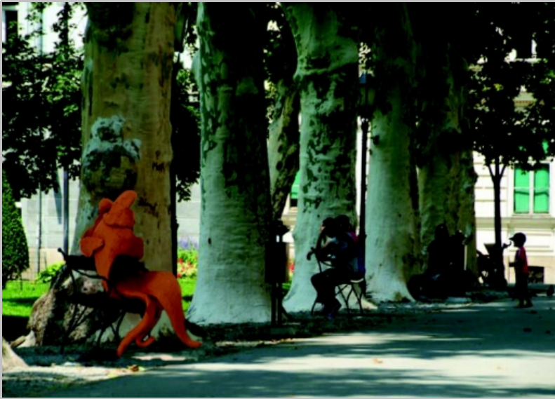
SI.3 Idejni primjer Razvijene forme, autor: Robert Kuhar, (Šetnica- Zrinjevac) Zagreb, Croatia, 2009.