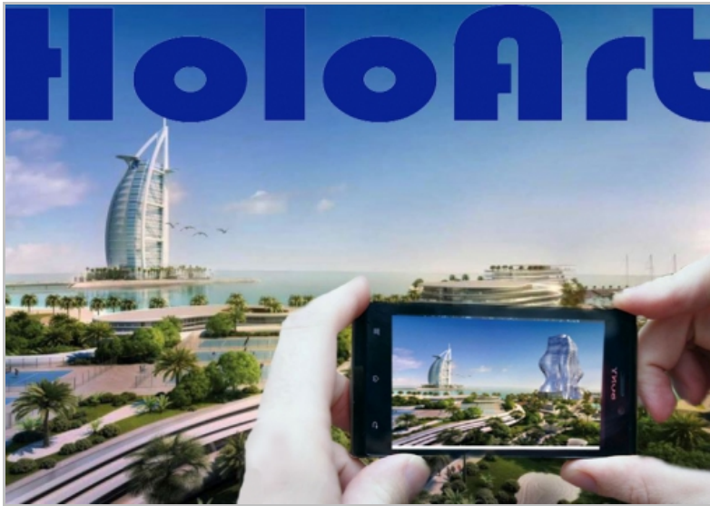
Sl. 2. Prijedlog za rješenje holograma, zgrada mijenja oblik, autor: Robert Kuhar, 2014