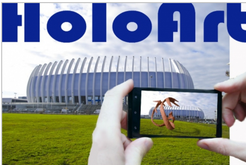
Sl.1.Idejni primjer, Razvijena forma, autor: Robert Kuhar, Zagreb, Croatia, 2010.

Idejni primjeri za izradu 3D virtualnih hologramskih rješenja