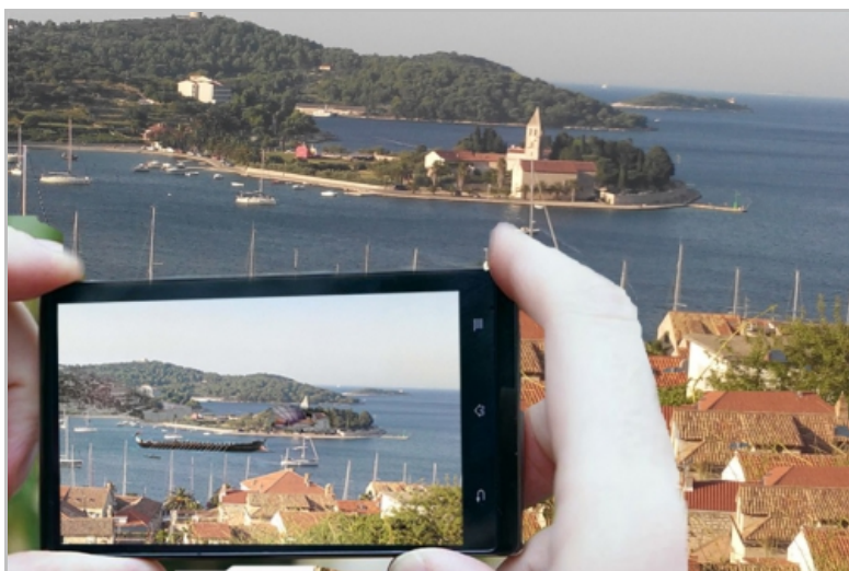
Sl. 3. Prijedlog za idejno rješenje 3D holograma, pogled na antički grad ISSA i kazalište na Ploču (Vis, Croatia) - prema arheološkim poznatim istraživanjima i pretpostavkama, autor: Robert Kuhar, 2014.