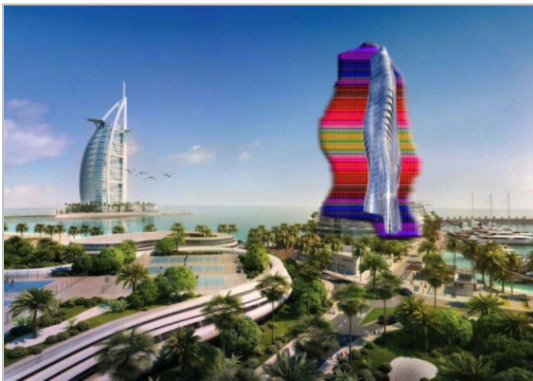
Sl. 3. Prijedlog za rješenje holograma, zgrada mijenja boje, autor: Robert Kuhar, 2014.