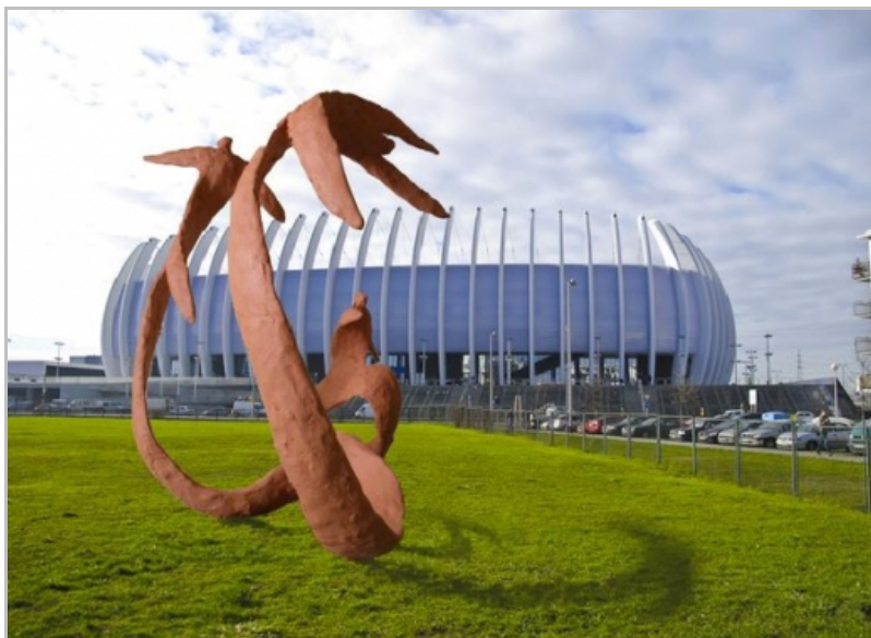
Sl.2.Idejni primjer Razvijena forma, autor: Robert Kuhar, Zagreb, Croatia, 2010.