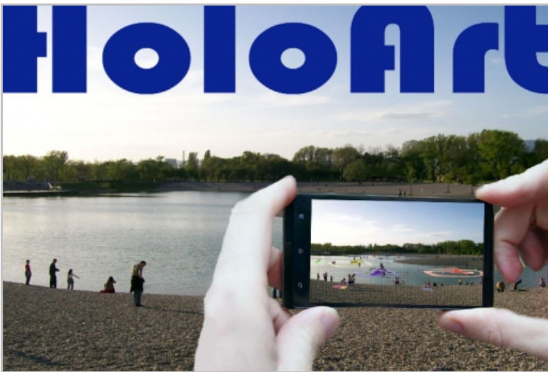
SI.4. Idejni primjer, Razvijene forme, autor: Robert Kuhar, (Bundek)Zagreb, Croatia, 2010.