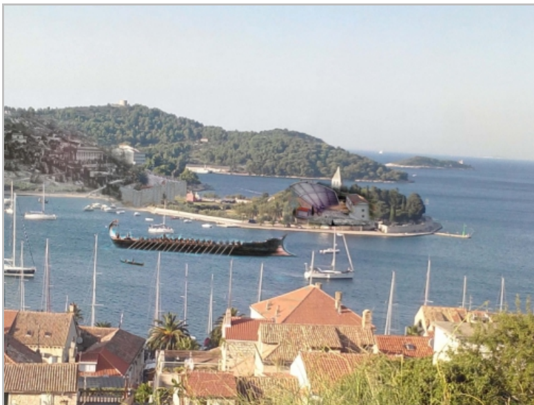
Sl. 4. Prijedlog za idejno rješenje 3D holograma, pogled na antički grad ISSA i kazalište na Prirovu (Vis, Croatia) -prema arheološkim poznatim istraživanjima i pretpostavkama, autor: Robert Kuhar, 2014.