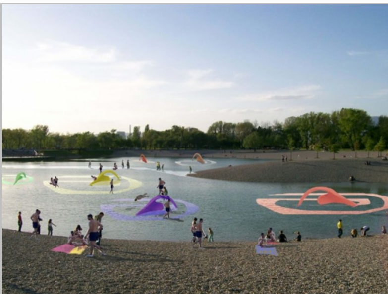
SI.5. Idejni primjer, Razvijene forme, autor: Robert Kuhar, (Bundek) Zagreb, Croatia, 2010.