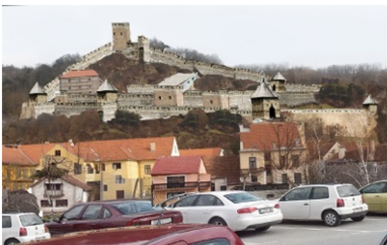
Sl. 2. Virtualni prikaz Starog grada Krapine na mobilnom uređaju-povećano