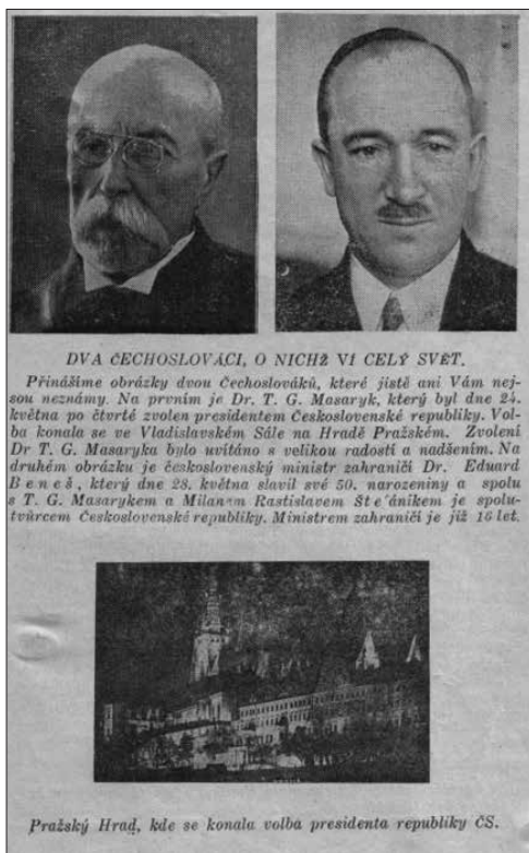
Prilog 4. Masaryk i Beneš, Dva Čehoslovaka koje poznaje cijeli svijet . Dětský koutek , br. 9-10, 1934., str. 137. Knjižnica osnovne škole J. A. Komensky, Daruvar.