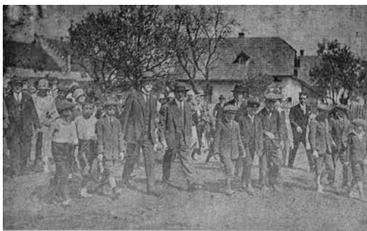
T. G. Masaryk u šol. Dneš mezi mládeží v Lázních.

Prilog 9. Masaryk s djecom na svom imanju Lany. Dětský koutek , br. 7, 1936., str. 103. Knjižnica osnovne škole J. A. Komenskog, Daruvar.