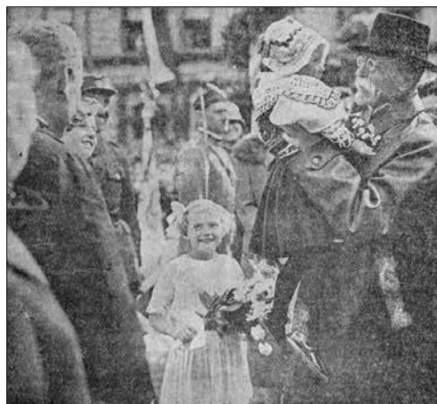
Prilog 8. Masaryk s djevojčicom u naručju. Dětský koutek , br. 6, 1936., str. 83. Knjižnica osnovne škole J. A. Komensky, Daruvar.