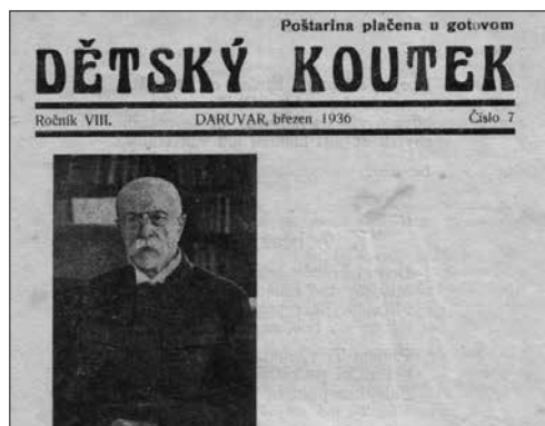
Prilog 7. Masaryk u radnoj prostoriji. Dětský koutek , br. 6, 1934., str. 79. Knjižnica osnovne škole J. A. Komensky, Daruvar.