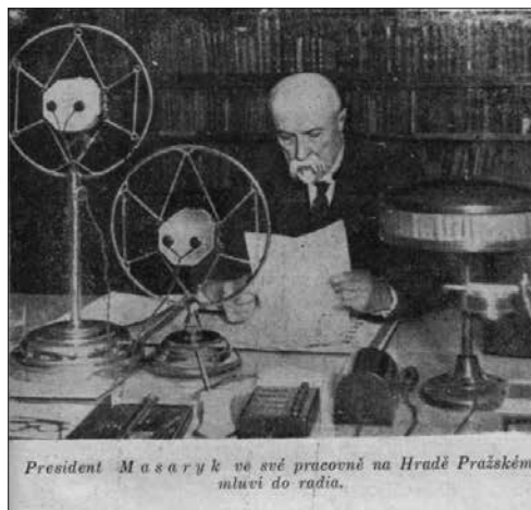
Prilog 6. Masaryk za radnim stolom. Dětský koutek , br. 1, 1937., str. 5. Knjižnica osnovne škole J. A. Komensky, Daruvar.