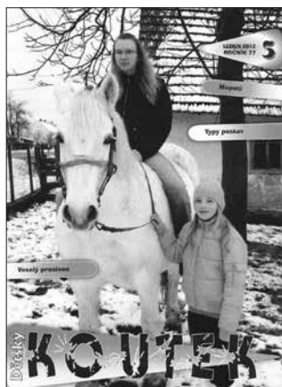
Prilog 2. Dětský koutek , br. 3, 2012., naslovna strana.