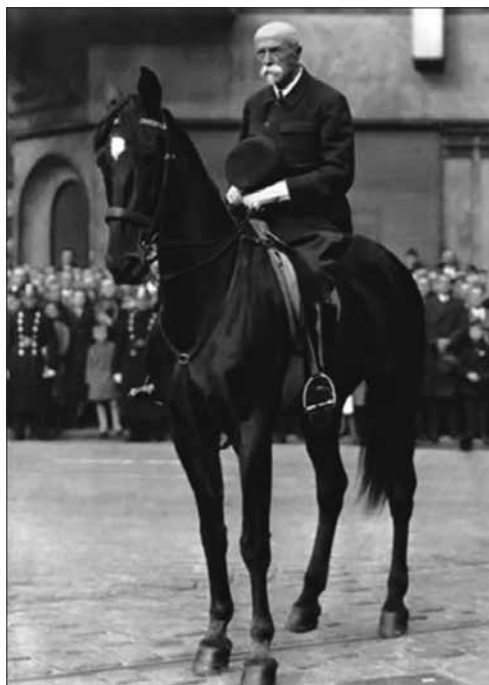
Prilog 5. Masaryk u vojnoj odori na konju. Dětský koutek , br. 8, 1939., str. 107. Knjižnica osnovne škole J. A. Komensky, Daruvar.