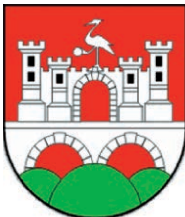
Slika 1. Današnji grb Daruvara

između dvaju svjetskih ratova za konstrukciju grba zaslužan je Stjepan Veltruski, a ždrala je kreirao kipar Vencel Satrapa (Cvanciger, 1975: 12). Polazna hipoteza jest to da se današnji grb Daruvara može dopuniti njegovom temeljnom funkcijom (funkcijama) da bi bolje prezentirao svoj identitet. Cilj ovog rada je prepoznavanje temeljnih simbola daruvarskoga kraja, odnosno percepcija njihova značaja za današnje stanovnike Daruvara.