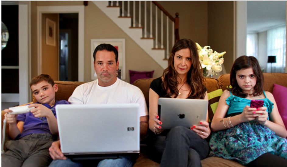
Slika 2: Suvremena obitelj