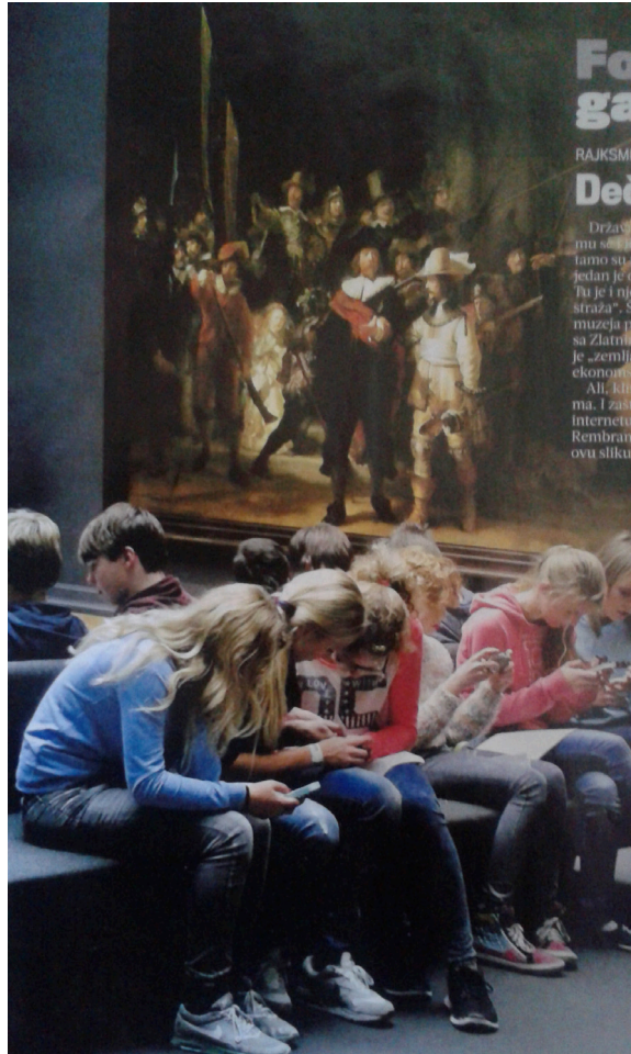
Slika 1: Muzej u Amsterdamu – budućnost umjetnosti?

Djeca nam odrastaju s tim kao najnormalnijom pojavom, a sve češće nam je sasvim u redu da vidimo i starije ljude kao konzumente današnjih “blagodati”.