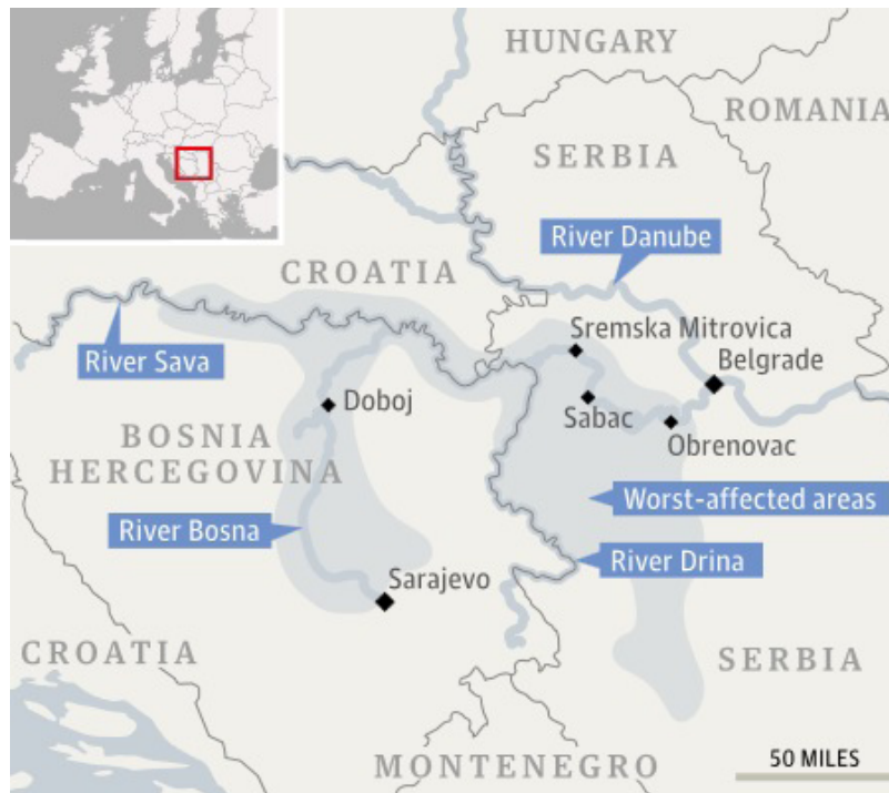
Slika 3: Shematski prikaz najugroženijih područja tijekom poplava na Balkanu, svibanj 2014.