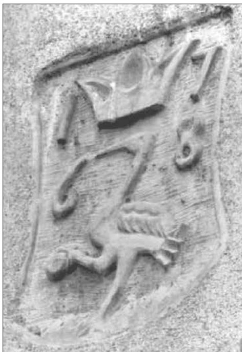
Slika 2. Prvi daruvarski grb u arhitekturi

potomstva. U počecima Antunove uprave nastala je zgrada vlastelinske žitnice u Daruvaru, smještena iznad kapele, a ispod budućeg dvorca. To je današnja zgrada Sokola, dio koji gleda prema češkom domu. Na zemljovidu s kraja 18. stoljeća vidi se tlocrt dvorca u obliku slova U, jugozapadno od dvorca kapela, a između zgrada žitnice. Na njezinu južnom zidu sačuvan je najstariji prikaz Antunova grba na nekoj građevini. O ovom grbu postoji kratka napomena u Cvancigera (1975: 11), da je bio (kurziv Z. P.) ugrađen na vlastelinsku žitnicu. Zgrada je u razdoblju između dvaju svjetskih ratova preuređena u sokolanu. Sretna je okolnost to što se grb uspio sačuvati. Ovaj pečat gradskog identiteta treba zaštititi kao najstariji očuvani 5 simbol budnosti ove obitelji i prostora nad kojima je ždral bdio. Inače su razne vrste ptica čest simbol u heraldici, a ždrala od ostalih močvarica prepoznajemo upravo po kamenu koji drži u desnoj uzdignutoj kandži (Zmajić, 1996: 39).