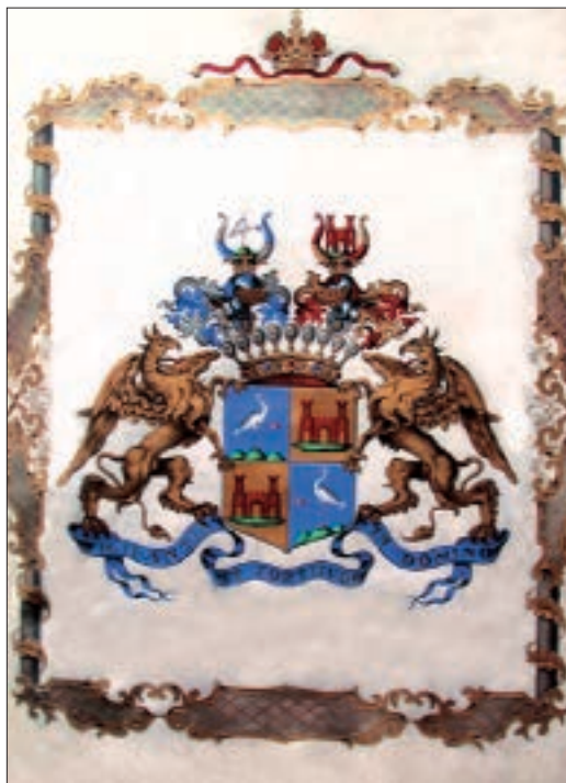
Slika 3. Grb obitelji Janković (ždral) nakon spajanja s grbom Montbel (utvrda)