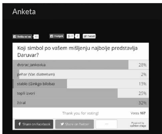
Slika 4. Internetska anketa

5) ždral (za ovaj simbol nije bilo potrebno ništa napominjati zbog njegove najveće rasprostranjenosti u svim sferama daruvarskoga života).