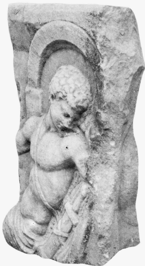
Trogir, zbirka Benediktinskog samostana sv. Nikole, fragment sarkofaga s početkom bočne strane sanduka

sarkofaga, ali se uz kompozicije iz Ahilejeva života može vezati tek devet ulomaka. 8