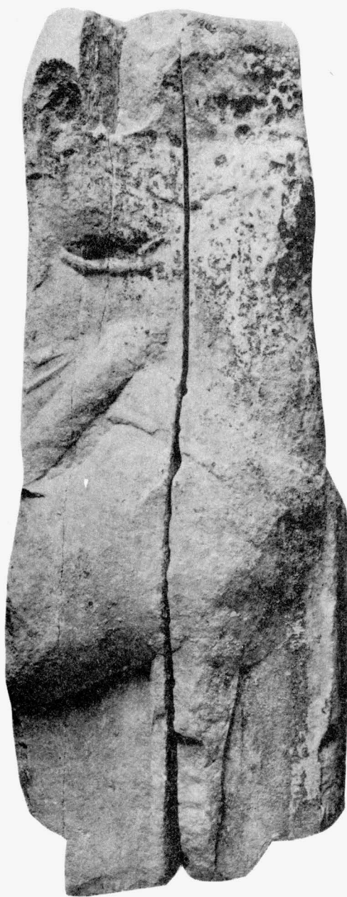
Trogir, zbirka Benediktinskog samostana sv. Nikole, fragment sarkofaga s konjima