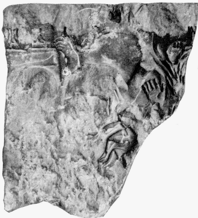
Trogir, Muzej grada, dio sarkofaga s prikazom Ahileja na Skirosu

koja su podignuta u vrijeme Justinijana. 24 Na zidinama antičke Attaleie (Antalya) na obali Pamfilije bio je ugrađen dio sarkofaga s prikazom Prijama koji kleči i moli Ahileja, a u drugom planu su likovi Hermesa i Briseide. 25 Moguće je da je mitološki sadržaj dijelom zaboravljen, pa su vojnici na scenama asociirali na obranu grada, a odnos Ahileja i Prijama na situaciju između pobjednika i pobijeđenog.