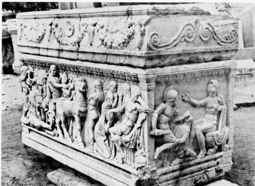
Tir, sarkofag br. 954 s motivima iz Ahilejeva života (po M. Chéhabu)

Drugi ulomak iz Salone pripada lijevom uglu duže strane sarkofaga i pod lukom je prikazana glava ratnika, a zasigurno je pripadala temi Ahileja i Prijama. 14 Možemo pretpostaviti da su sarkofazi s temama o Ahileju koji imaju izolirane arкаде u uglovima, pripadali istoj seriji antičke produkcije, pa su možda i zajedno dovozeni do odredišta na jadranskoj obali.