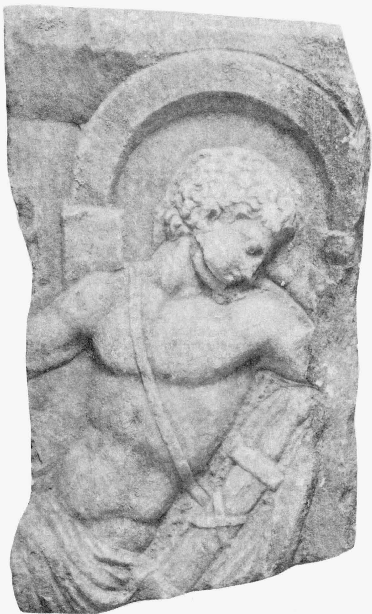
Trogir, zbirka Benediktinskog samostana sv. Nikole, fragment sarkofaga s likom Ahileja