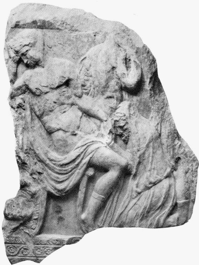
Zadar, Arheološki muzej, dio sarkofaga s likovima Prijama i Ahileja

Najveći reljef otkupa Hektorova tijela u Dalmaciji, uz novopronađene trogirske ulomke, čuva se u Arheološkom muzeju u Zadru. Na njemu su likovi prikazani zrcalno, odnosno tok zbivanja ide s desna nalijevo, što mu daje jedinstveno mjesto u nizu dosad poznatih primjeraka ovog tipa sarkofaga. Na uzdužnoj strani u lijevom uglu sjedi Ahilej, a pred njim desno je na koljenima Prijam. Između njih je u drugom planu lik Hermesa, a pokraj njega dio draperije neke figure u kratkim čizmama. Ahilej sjedi na stolcu, bez mača na ramenu, a na podu mu je naslonjen šljem. Na gornjem rubu sarkofaga je jednostavna kosa greda, dok je podnožje bogato ukrašeno urezanim spiralama, valovnicama ispunjenim rozetama i lišćem. Promjena smjera