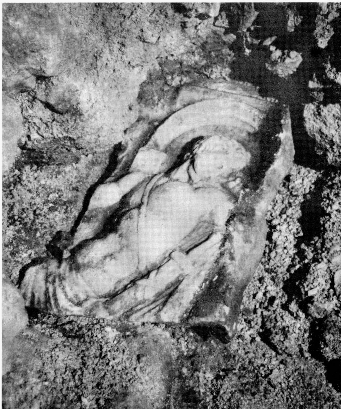
Trogir, crkva sv. Nikole, fragment sarkofaga prilikom nalaza

Hektorov oklop. Na sredini kompozicije su kola s konjima, vojnici koji pridržavaju uzde i sluge koje timare konje. Zatim slijedi polugoli Ahilej koji sjedi na stolcu, glave naslonjene na lijevu ruku s mačem prebačenim preko prsiju i šljemom pored nogu. Pred njim kleči starac Prijam pokriven plaštom i ljubi mu ruku. U pozadini, iza Ahileja, nekad je prikazan samo Hermes koji dovodi Prijama do Ahilejeva šatora, često u paru s Briseidom, Ahilejevom robinjom, a nekad s Hekubom, Prijamovom ženom. 4