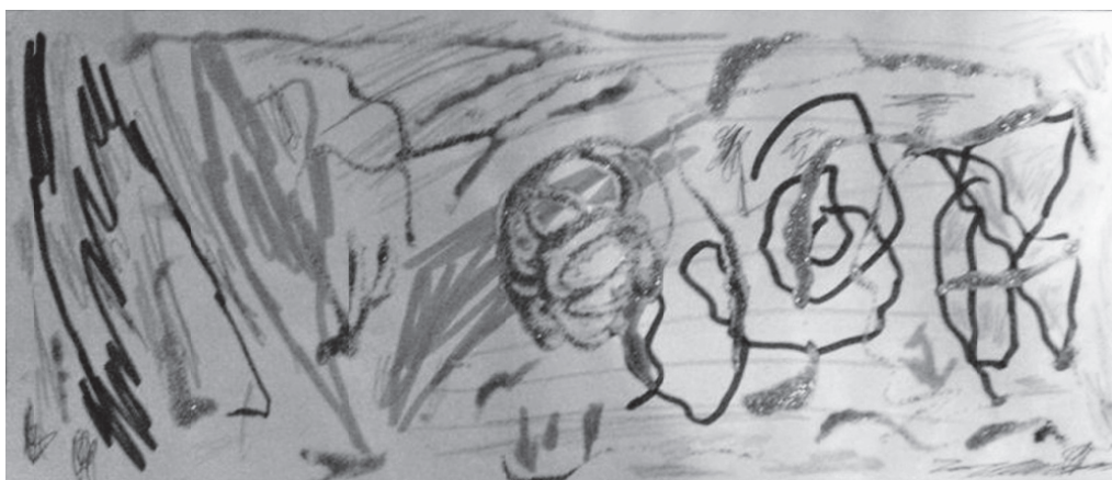
Slika 4. Tema „Sreća“

Autor ovog i predhodna dva crteža dječak je od 6 godina koji prema obliku i pozicioniranosti likova u prostoru, prikazuje tri veoma slične figure. Kod figure oca fokusira se na lice koje oštrim crtama i zubima predstavlja osobu čija riječ u obitelji ima snagu najjačega. Figura majke je predstavljena u cijelosti, po izrazu i obliku lica podsjeća na oca, ali je dotjerana, s naušnicama, torbicom, štiklama i nalakiranim noktima. Figura dječaka slična je figurama roditelja, ali njegov je osmijeh ograničen vertikalnim crtama kao graničnicima koji, uz mirne crte lica, inhibiraju taj osmijeh, a koturaljke na nogama dodatno naglašavaju dinamičnost figure dječaka u pokretu. Tijekom likovne aktivnosti primjetna je pojačana verbalna ekspresija ponajviše kopolalničnim verbalnim izrazom što dječakovoj agresivnosti daje određeni specifikum. U prisustvu psihologa dječak daje socijalno poželjne odgovore, a prema odgojiteljici, u vrijeme dok psiholog nije prisutan, vrlo je agresivan i deciderano joj pretpostavlja svoja prava. U svim aktivnostima većinu vremena provodi čineći drugoj djeci razne nepodopštine i opstruirajući rad odgojitelja.