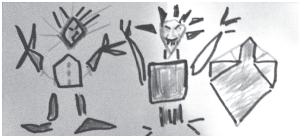
Slika 1. Tema „Ja“

Odgojitelj pismeno analizira dječje crteže prema temama koje su ponuđene prije nego što studenti uđu u proces prakse u vježbaonici.