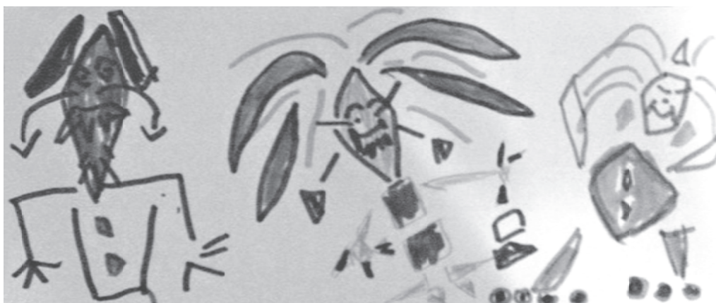
Slika 3. Tema „Moja obitelj“

Autor ovog i predhodna dva crteža dječak je od 6 godina koji prema obliku i pozicioniranosti likova u prostoru, prikazuje tri veoma slične figure. Kod figure oca fokusira se na lice koje oštrim crtama i zubima predstavlja osobu čija riječ u obitelji ima snagu najjačega. Figura majke je predstavljena u cijelosti, po izrazu i obliku lica podsjeća na oca, ali je dotjerana, s naušnicama, torbicom, štiklama i nalakiranim noktima. Figura dječaka slična je figurama roditelja, ali njegov je osmijeh ograničen vertikalnim crtama kao graničnicima koji, uz mirne crte lica, inhibiraju taj osmijeh, a koturaljke na nogama dodatno naglašavaju dinamičnost figure dječaka u pokretu. Tijekom likovne aktivnosti primjetna je pojačana verbalna ekspresija ponajviše kopolalničnim verbalnim izrazom što dječakovoj agresivnosti daje određeni specifikum. U prisustvu psihologa dječak daje socijalno poželjne odgovore, a prema odgojiteljici, u vrijeme dok psiholog nije prisutan, vrlo je agresivan i deciderano joj pretpostavlja svoja prava. U svim aktivnostima većinu vremena provodi čineći drugoj djeci razne nepodopštine i opstruirajući rad odgojitelja.