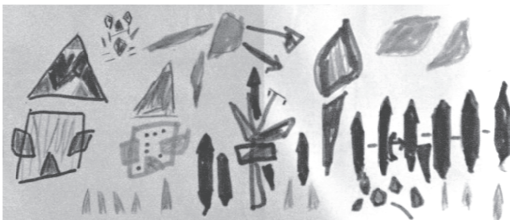
Slika 2. Tema „Moja kuća“

Oblici kuće na temu „Moja kuća“ istog djeteta prikazani su na sličan, dezintegriran način gdje dijete svjesno izbjegava kružne ili ovalne oblike kao što su lice, sunce, oblak, krošnja drveta i crta ih kao rombove, za razliku od druge djece koja to najčešće prikazuju kružnim oblicima kao razvojno prvim oblicima u dječjem grafičkom izražavanju. U crtežu gotovo da nema nijednog oblika koji asocira na oval. Dijete je zaokupljeno detaljima, zubi u ljudskoj figuri nacrtani su kao oštrice, a slično su prikazane i šake, prsti, pramenovi kose, sunčeve zrake, latice cvijeta. Kosina i oblik očiju na gotovo trokutastom licu s izduženom i zaoštrenom bradom još su jedan od načina na koje ovo dijete iskazuje potrebu da preko svojih likova pošalje vizualnu poruku kako su „oni opasni“. Razjedinjena figura djeluje zlokobno što na neki način simbolizira djetetovu agresivnost.