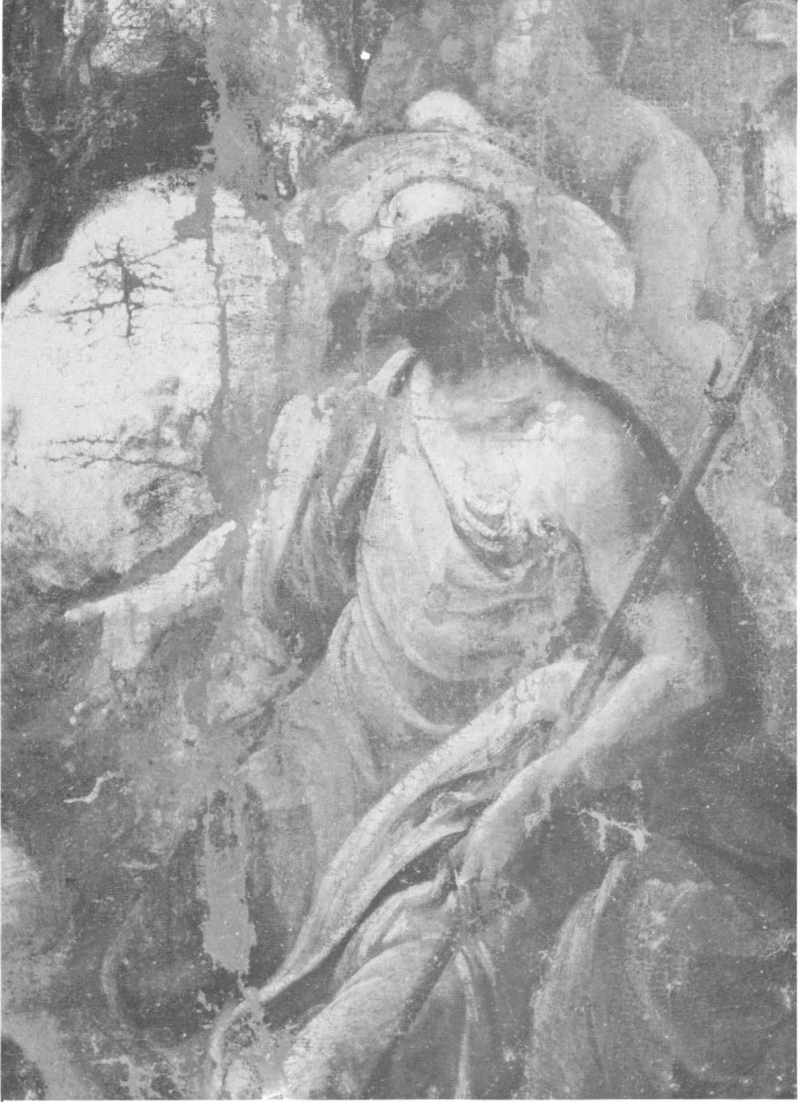
Pieter de Coster, Bogorodica s Djetetomj i svecem, Split, Samostan sv. Frane, detalj