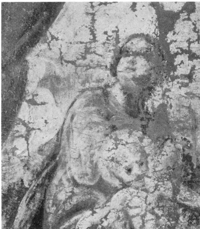
Pieter de Coster, Bogorodica s Djetetom i svecem, Split, Samostan sv. Frane, detalj

impostiran, prikazan u poluprofilu. Bogorodica je odjevena u izbljedjelu ružičastu haljinu bijelih lumeggiatura preko koje je prebačen plavi plašt oštih nabora. Okruglo, osvjetljeno i mekano modelirano lice okrenuto je udesno, lagano podignuto prema nebesima, a na njemu se ističu pune, sočne usne. Dijete rumenih obraza i zlačane kose, skliznulo je niz majčine skute, šireći ručice, zaneseno u vlastitoj igri. Dva neobična, poput ugaraka crna oka gledaju u sveca podno Bogorodičnih nogu. Ona sjedi i levitira na pokrenutoj masi snježnih kumulusa, okružena razigranim puttima, od kojih dvojica s lijeve strane, jedan svijetlokos, a drugi tamnih vlasi, hvataju skute njenog plašta. S desne se strane oveći anđelak naklatio na oblake podno Bogodrodičnih nogu, gledajući zamišljeno dolje na posjelog sveca. Nebo je iza Bogorodice osvjetljeno nestvarnim žutilom zalaska sunca, a na lijevoj strani slike teška crvena zavjesa kao da se upravo podigla u svečanoj predstavi ovog uzvišenog nebeskog prizora. U donjem dijelu slike ispod Bogorodice, a ispred mračnog prolaza zasvedenog lukom, kroz koji se u daljini naziru kuće, sjedi svetac. Prikazan je u poluprofilu, ispružene lijeve noge koja se oslanja o tlo s pokojim sparušenim grmom i travkom. Čelav je, duge brade, s licem u profilu. Pogled je smjerno podigao prema Bogorodici i djetetu, podižući u gestu adoracije desnu ruku, dok je ljevicom obuhvatio hodočasnički štap s kuglom na vrhu i kukom za vješanje tikvice za