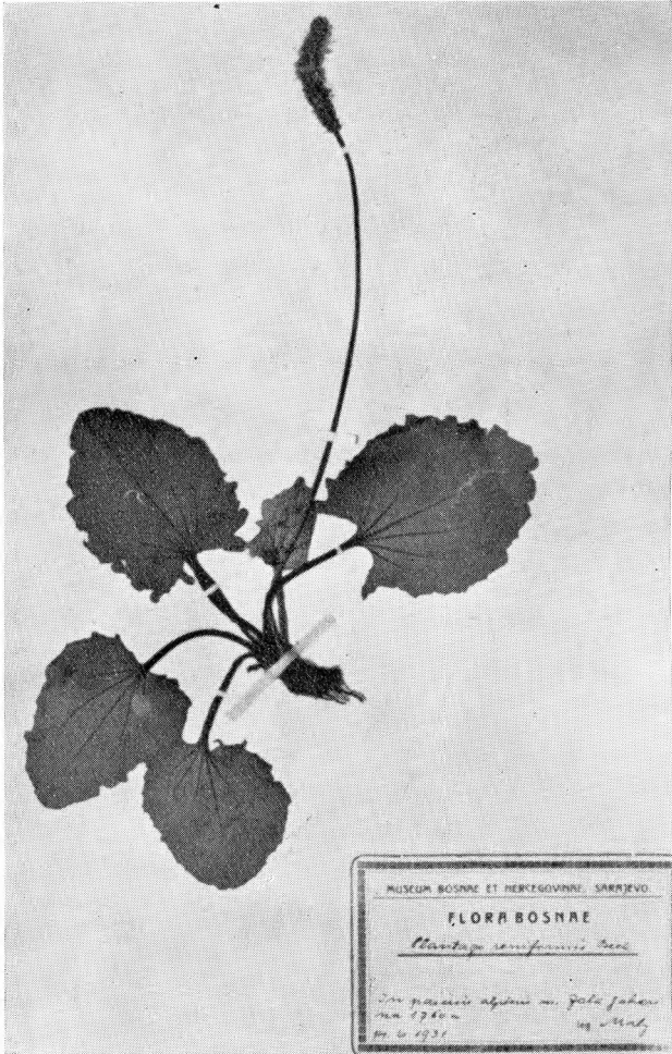
Plantago reniformis Beck