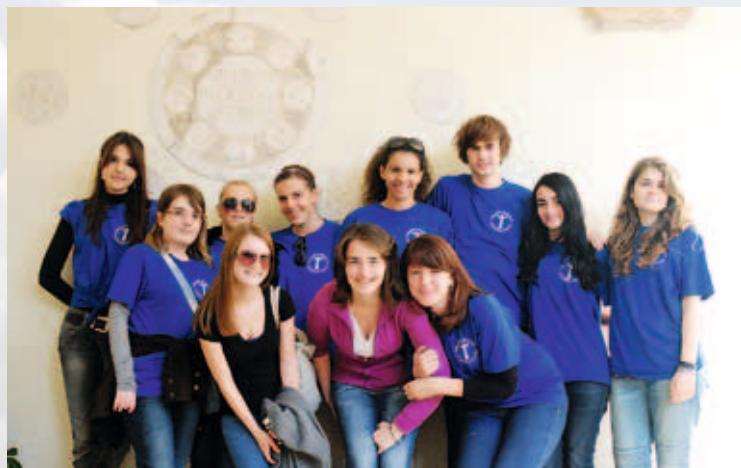
Mladi iz Franjevačke mladeži

Povijest Bosne Srebrene jest bila teška. No, ono što Bosnu Srebreanu čini velikom jest činjenica da su njezini franjevci u svim teškim trenutcima bili dovoljno razboriti i s pogledom daleko u budućnost. Njihovo zalaganje za svoj vjerni puk i na vjerskom i na kulturnom i na političkom polju zaslužuje svaki respekt. Stoga se ne smijemo samo diviti i hvaliti svojom velikom prošlošću, nego uspješno djelovati u sadašnjosti. Ova povijest treba nas, današnje franjevce Bosne Srebrene, potaknuti da evanđeoskim životom, svjedočenjem i zalaganjem za svakog čovjeka budemo svjetlo ovom narodu i ovoj zemlji nad koju su se našalost nadvili mračni oblaci. ❖