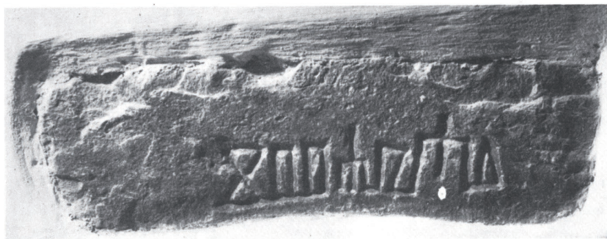
Sl. 6. Hum, glagoljski natpis oko 1500. god.