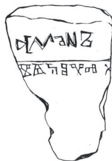
Sl. 1. Supetarski ulomak

O njemu vidi studiju ovdje (str. 55-62). 2