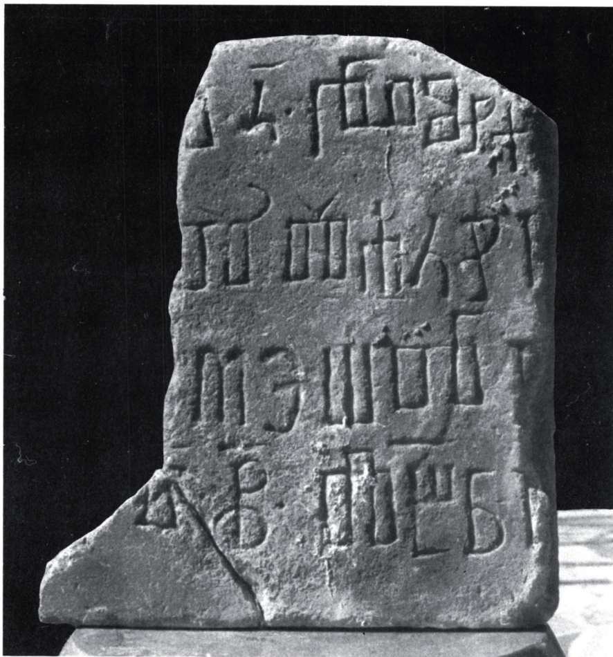
Sl. 2. Vrbnik, glagoljski natpis iz godine 1340.

Zapažen je u Vrbniku na otoku Krku, u gradskome predjelu »Pod zvonik«, kao spolij u zidu krušne peći na kući br. 81 (vlasnica: Cecilija Matanić). 3 Ulomak je bijele mramorne ploče, dug 30,5 cm, visok 33,5 cm, debeo 4 cm. Sl. 2. Ne znamo mu prvobitnu namjenu ni smještaj, niti pravo proričemo u sadržaj teksta.