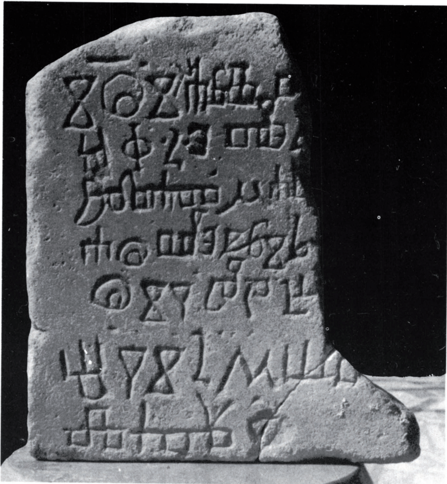
Sl. 3. Vrbnik, glagoljski natpis iz godine 1546.

Vodeći računa o mjeri izgubljenog teksta može se – po analogijama i prema utvrđenim arhivskim podacima – pročitati i nadopuniti taj natpis ovako: