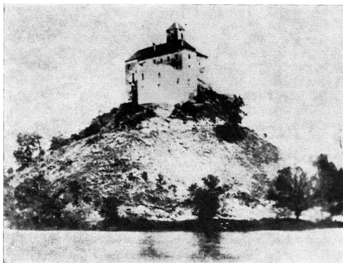
27. J. Drašković, Trakošćan u doba obnove , foto

Prilazeći gradu, zapravo ga zaobilazimo, i to ne samo prilaznim putem oko brežuljka nego i kad se uđe u sam krug dvorca, preko pokretnog mosta, dolazimo gradu sa sjevera, prolazimo kroz ulaznu sjeverozapadnu kulu, staru jugozapadnu i izlazimo na terasu s južne strane dvorca. Osim tog ulaza postoje još i služinjski ulazi. Čitava organizacija prostora dvorca