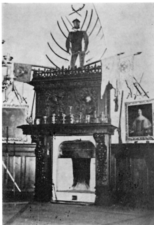
29. Trakošćan, viteška dvorana

Ono što je možda najznačajnije, a što priznaje i Gj. Szabo, inače zakleti protivnik historicizma i svih pseudo-stilova, a posebno normanskog stila Trakošćana, je potpuno i skladno uređenje okoliša, prirode i objekta. 3 Uređenjem Trakošćana, naime, obuhvaćena je i sva okolica. Slijev gorskih potoka, iz kojih istječe rječica Bednja, reguliran je branom u veliko umjetno jezero koje okružuje kultivirana šuma, zapravo veliki