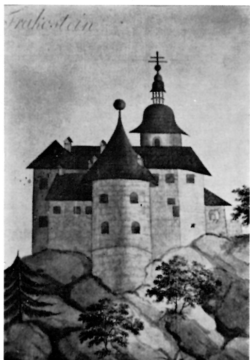
26. S. Drašković, Trakošćan , akvarel, početak 19. st.

interpretaciji dvorca nastojat ćemo posebno upozoriti na promjene koje su nastale tijekom stotinjak godina nakon obnove.