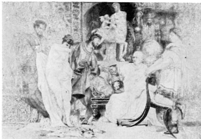
142. Dimitrije Marković, Robinja

1853. 22. XII, rođen u Rijeci, gdje je završio šest razreda realne gimnazije 1874—1876. na Umjetničko-obrtnoj školi u Beču. 1876—1878. na Kraljevskoj akademiji risarskih umjetnosti u Firenci. 1879. 8. X, otpisom Zemaljske vlade u Zagrebu bio premješten s realke u Bjelovaru kao namjesni učitelj na Kraljevsku veliku realku u Osijeku. 1880. izradio portret bana Ladislava Pejačevića (crtež olovkom) i izložio ga. 1880—1881. oslobođen dužnosti učitelja na realci radi priprema za učiteljski ispit. Stoga boravi na Kraljevskoj akademiji risarskih umjetnosti u Firenci. 1881. odlikovan od Akademije u Firenci kolajnom za svoje radove.