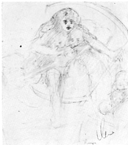
149. Milan Milovanović, Kolera , 1915.