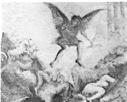
145. Milan Milovanović, Kompozicija iz rata , 1914.