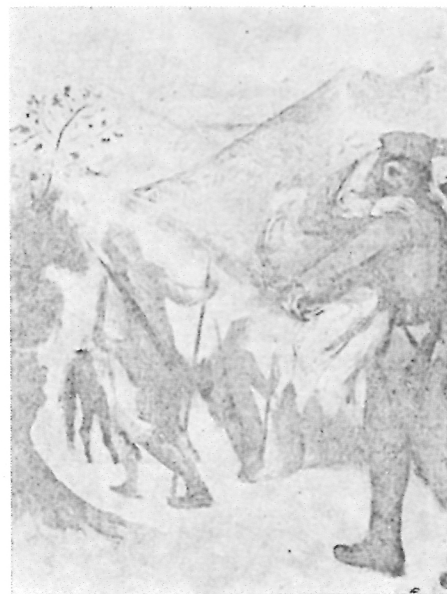
147. Milan Milovanović, Povlačenje srpske vojske preko Albanije , 1915.

na Milovanoviću bliži način — prikazivanjem ratnih strahota i leševa kroz alegorijske vizije. Te ratne alegorije obavezno sadrže anđeoske figure sa bakljama koje lebde nad telima, odnosno dušama postradalih (Sl. 8). Dva nedavno pronađena ulja, 12 od kojih je jedno po dimenzijama najveća Milovanovićeva kompozicija iz rata 13 (Sl. 9), svedočanstvo su takvog slikarskog pristupa ratnoj temi.