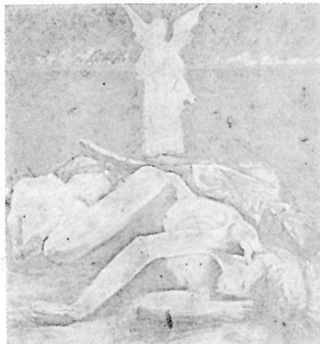
146. Milan Milovanović, Kompozicija iz rata , 1914.