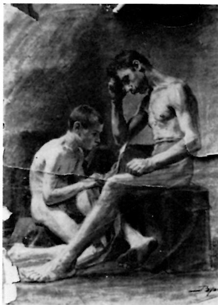
156. Mihailo Vrbica, Dvojni muški akt, olovka