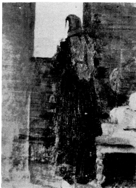
157. Mihailo Vrbica, Kraj prozora, ulje