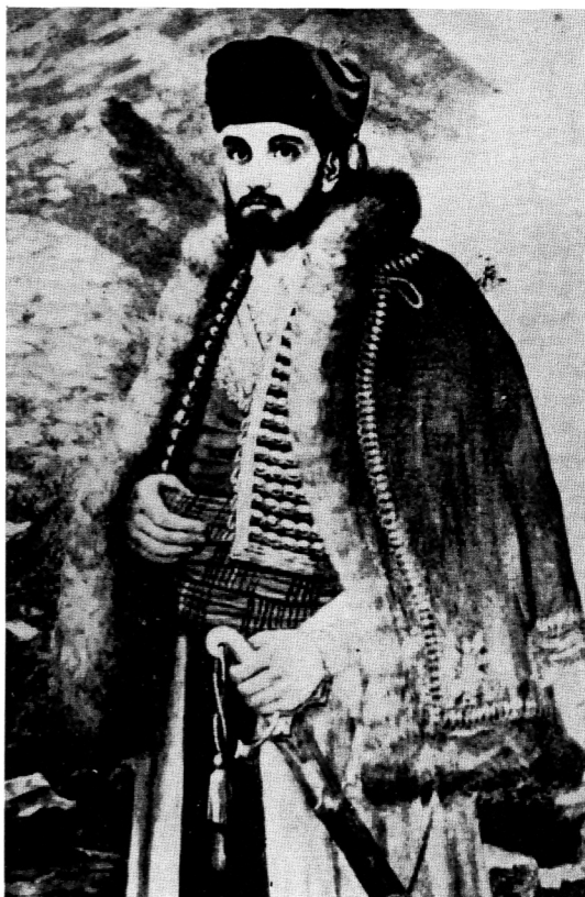
152. Mihailo Vrbica, Portret Vladike Danila, ulje

slikara (Mihaila Vrbice) koji je u Rusiji, kao crnogorski stipendista završio umjetničku stručnu školu, a docnije i Visoku slikarsku akademiju, predstavlja veliki napredak u širenju likovne kulture u Cetinju, a posebno u djelatnosti na polju razvoja slikarstva u Crnoj Gori.