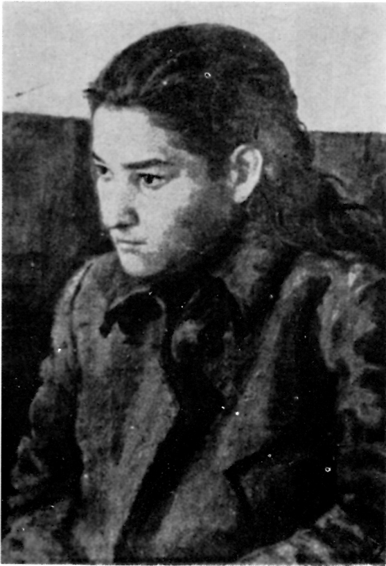
154. Mihailo Vrbica, Portret djevojčice, ulje