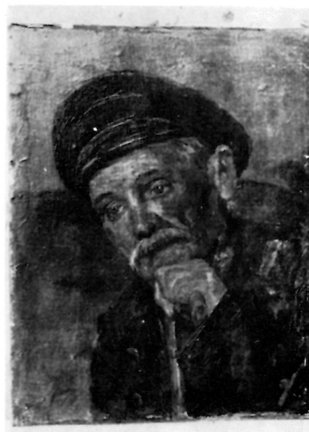
158. Mihailo Vrbica, Portret starca, ulje

u vještini slikanja portreta, ali se ogleda i u drugim žanrovima.