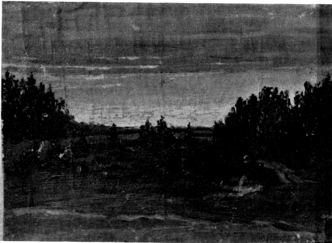
159. Mihailo Vrbica, Pejzaž, ulje

djela, koju zbog vremenskog ograničenja danas ne možemo proširiti.