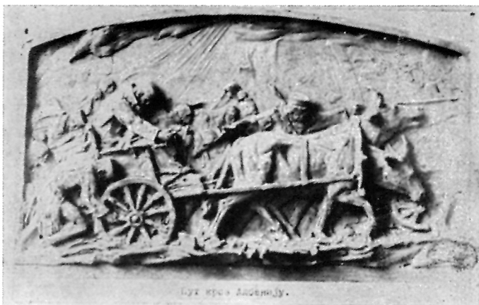
193. Rudolf Valdec, Projekat I, Put kroz Albaniju , reljef