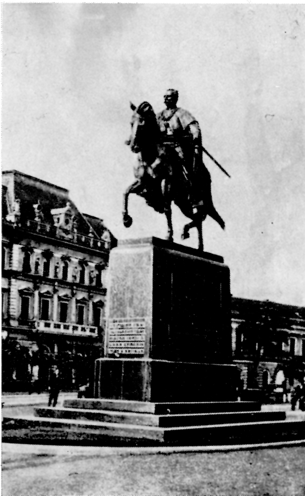
191. Rudolf Valdec, Spomenik kralju Petru I, Zrenjanin