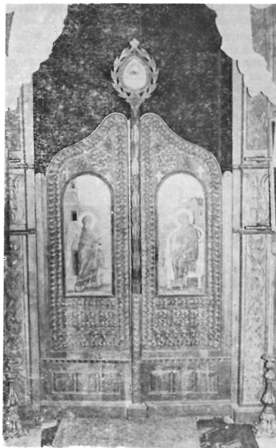
222. Царските двери од иконостасот, во С. Трново