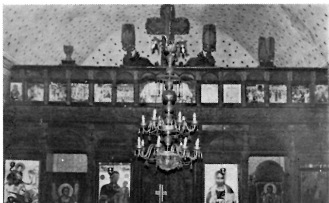
220. Иконостасот при параклисот во Митрополијата