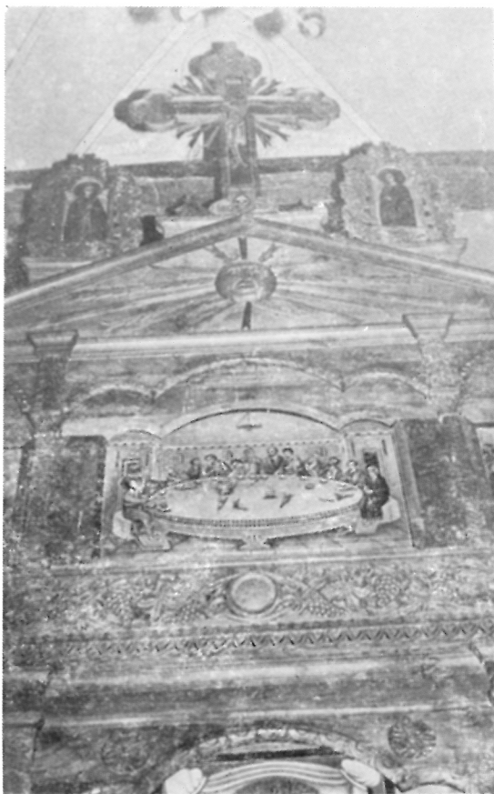
221. Тимпанот од иконостасот во црквата во С. Трново