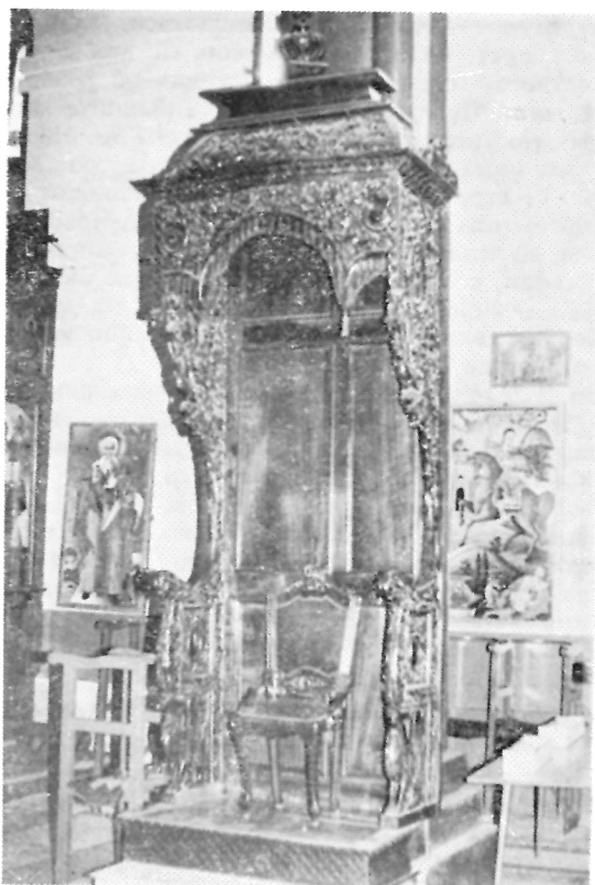
218. Престолот, Црквата Св. Кирил и Методиј, Прилеп