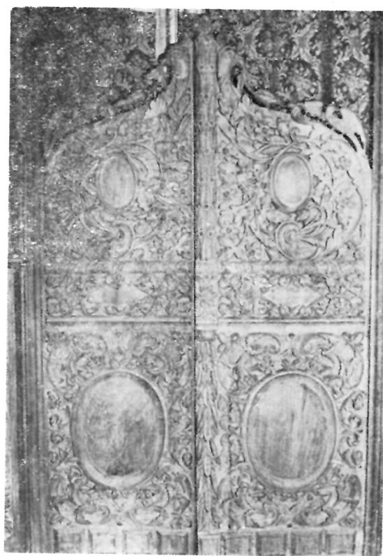
219. Царските двери од иконостасот изработен за Митрополијата во Битола

"Кралскиот престол во резба, кој не е позлатен, наместен е на своето место 1929 год. Со неговата набавка ме- родавните црквени фактори, уште еднаш покажаа дека при дополнувањето и усовршувањето на делата на прет-