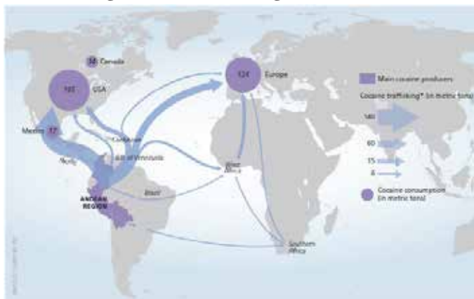
Slika 1. Organizirani kriminal, globalna kokainska ruta