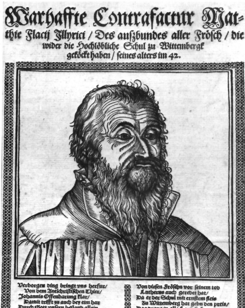
2. Autor nepoznat, 1562., letak s drvoreznim portretom M.V.I 130x129 mm (portret) i njemačkim tekstom. Naslov: Warhaffte Contrafactur Matthie Flacij Illyrici / Des auszbundes aller Frösch / die wider die Hochlöbliche Schul zu Wittenberg gekökt haben / seines alters im 42 ; Germanisches Nationalmuseum Nürnberg.

Na Vlačićev lik s ovoga podrugljivog letka ili nekog sličnog predloška oslanja se njegov portret što ga je 1565. priredio grafičar iz Nürnberga Balthasar Jenichen (sl.3)11. Jenichen je, međutim, Vlačića i slikom i riječju prikazao u izrazito pozitivnu svjetlu. Njegovu su liku vraćeni ozbiljnost, dostojanstvo i snaga. Svi fiziognomski elementi koji liku s podrugljivog lista daju neurotičan izgled, ovdje su ublaženi. Istaknuta su široka prsa, glava je snažno uspravljena, crta stisnutih usana mekana, nos smanjen, pogled čvrst i upravljen u daljinu. Jenichenovi bakropisni portreti oponašaju predloške u grubim crtama, no nedostatna sličnost s izvornim izgledom prikazanih osoba nadomještena je popratnim komentarom, koji ocrta "duhovni" lik prikazanoga. U njemu piše da je Vlačić mnogo pretrpio zbog Božje riječi, za koju se borio svom snagom. Osobito su oštro protiv njega pisali