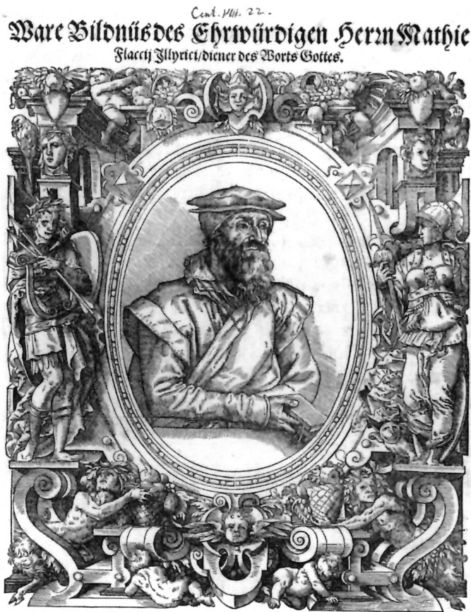
7. Tobias Stimmer, 1571, letak s drvoreznim portretom M.V.I. i ukrasnim okvirom 255 x 220 mm (sam portretni oval oko 145 x 110 mm), (na ovom primjerku odrezan je donji dio s njemačkim tekstom Hansa Fischardta). Naslov: Ware Bildnüs des Ehrwürdigen Herrn Mathie Flacij Illyrici / diener des Worts Gottes ; Staatliche graphische Sammlung München .

Unatoč svim priznanjima njegovih teološko-povijesnih djela i borbe protiv interima, oznaka manihejca pratila je Vlačića, koji je ustrajno branio svoje uvjerenje do kraja života. Tu oznaku nalazimo i na trima Flaciusovim portretima, objavljenima nakon njegove smrti.