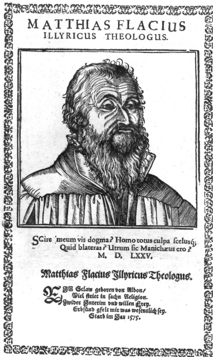
10. Autor nepoznat, vjerojatno 1575., letak s drvoreznim portretom M.V.I., 130 x 125 (portret). Naslov: Matthias Flacius Illyricus theologus. Germanisches Nationalmuseum Nürnberg.