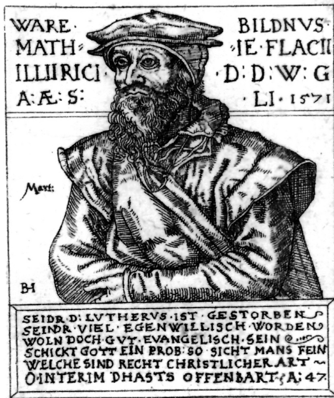
8. Balthasar Jenichen, 1571., bakropis 82 x 70mm. Statilische graphische Sammlung München.

Ware Bildnüs des Ehrwürdigen Herrn Matthiae Flacii Illyrici Diener des Worts Gottes.