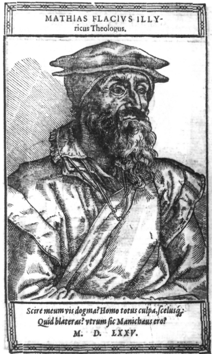
11. Autor iz kruga Tobiasa Stimmera, vjerojatno 1587., drvorez 150 x 80. Otisnut u knjizi Nikolaus Reusner, Icones sive imagines vivae, literis cl. virorum (...) , Basel 1589. (2. lat. izdanje). Universitätsbibliothek Tübingen.

Na dvama slijedećim portretima koji su se pojavili kao knjižne ilustracije u 16. stoljeću Vlačić je predstavljen likom prema Stimmerovu obrascu iz 1571., no tekstualni komentar ispod portreta u jednome slučaju doslovno prepisuje, a u drugom se oslanja na sadržaj wittenberške "osmrtnice".