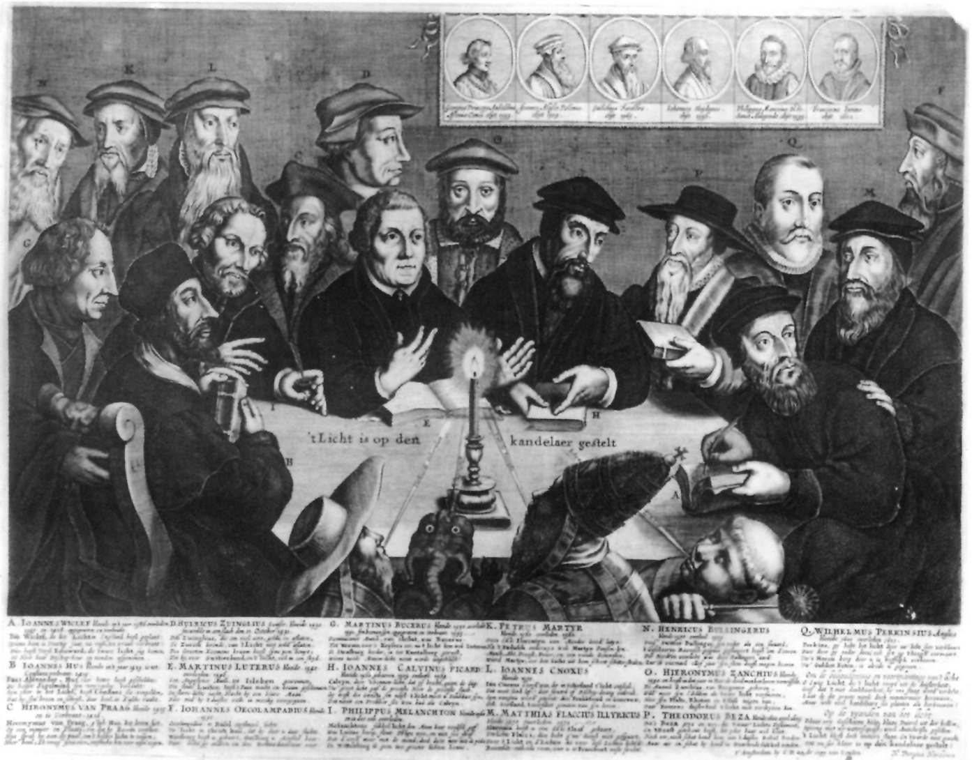
14. Nepoznati autor, između 1620. i 1650., letak s grupnim portretom velikana reformacije, 395 x 528 mm (cijeli list). Flacius označen slovom M. Naslov: 'tLicht is op den kandelaer gestelt. Kunstsammlung der Veste Coburg.

prikazavši ga krupnim i snažnim. Lice gotovo bez bora, izbjegnuto je dojam koščate mršavosti. Usne su jasno oblikovane i pravilne, nos manje šiljat i ravniji, oči jasnije, brada crtački uredno stilizirana. Neugledni lik sa Stimmerova portreta pretvoren je u sliku samopouzdanog i dostojanstvenog muškarca gotovo klasične statuarosti.