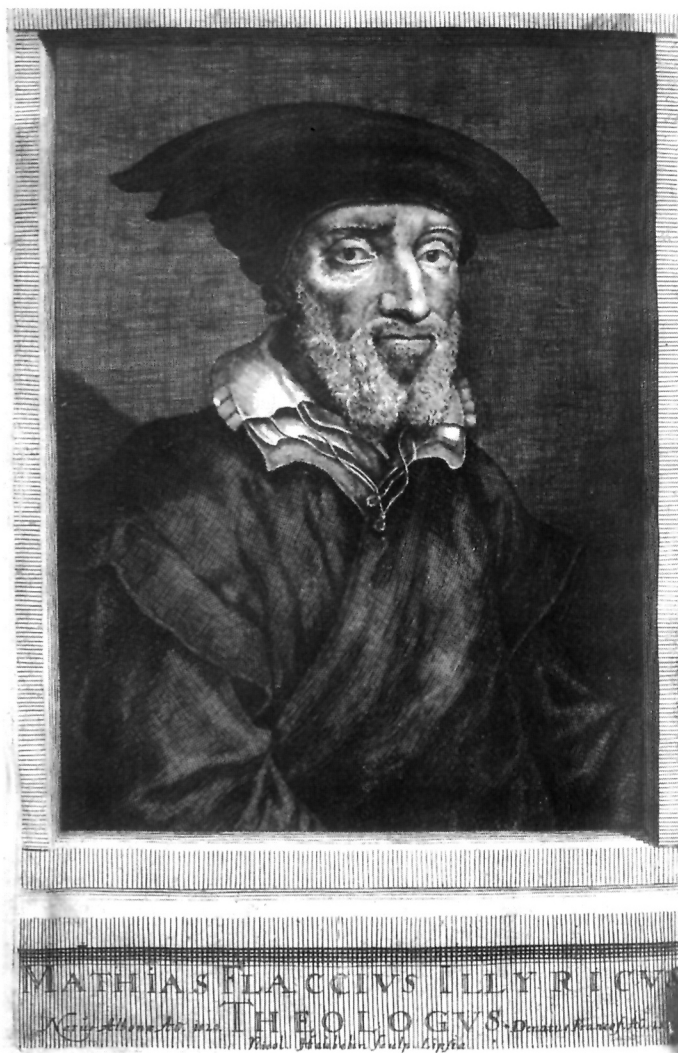
15. Nicolaus Häubelin, vjerojatno. 1674., bakropis i bakrorez 295 x 185 (otisak). Universitätsbibliothek Tübingen.

Ubrzo potom, kad unutrašnja sukobljavanja u Evangeličkoj Crkvi u Njemačkoj uglavnom prestaju, Vlačićevu popularnost sve više određuje njegova postojana borba za reformaciju (Verheiden i letak s reformatorima okupljenim oko stola sa svijećom,) te njegova teološka djela, napose "Clavis Scripture sacrae", u kojem svojom metodologijom interpretacije pojmova Svetog pisma stvara temelje modernog, hermeneutičkog pristupa biblijskom tekstu. 25