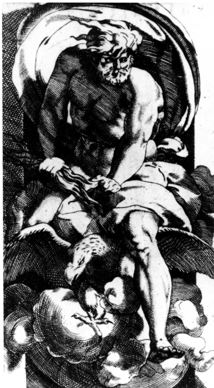
6. G. J. Caraglio: Zeus, grafika po Rossu Fiorentinu

U ciklusu zidnih slika "Priče o Genezi" iz vatikanskih Loggia (1518.-1519.) Rafael je prikazao Boga Oca u vrlo sličnom, ali zrcalno postavljenom položaju, kako je, umjesto orla, opkoračio oblak te također raširenih ruku i jednako povijenih i dubinom prostora razmaknutih nogu 15 . Rafaelove zidne slike iz Loggia prikazao je