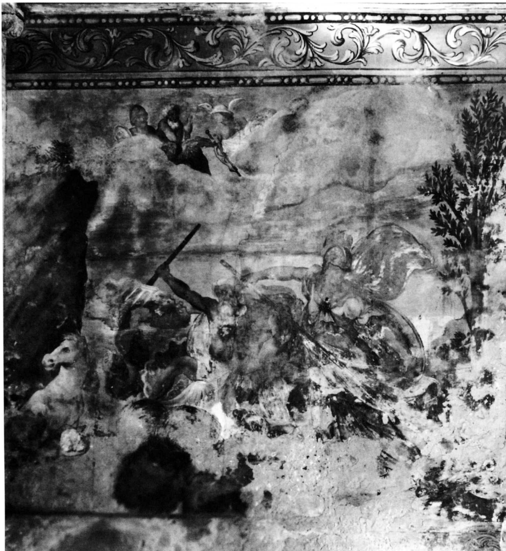
7. Natjecanje Atene i Neptuna za atičke zemlje, Sorkočevićev ljetnikovac u Rijeci dubrovačkoj

godine 1615. na pedeset dva grafička lista Orazio Borgiani, jedan od najznačajnijih slikara rimskoga ranog baroka. Vjerojatnost da je lik Boga Oca prikazao neki drugi grafičar zrcalno nije isključena, jer su se Rafaelova djela često u grafikama ponavljala. I varijante prikaza Zeusa kako je opkoračio orla ponavljaju se u mnogim grafikama izvedenim prema djelima majstora 16. stoljeća. Od Michelangelova crteža "Pad Faetonov" do nekoliko grafika Jacopa Caraglija (1500. Verona - 1565. Krakow) u kojima ponavlja Rossa Fiorentina 16 . Jedan od Caragliovih kopista prikazao je njegov grafički list zrcalno, tako da je položaj Zeusovih nogu vrlo sličan kao na zidnoj slici iz ljetnikovca. Između takvih se varijacija u rješenju Zeusa s orlom i Rafaelova postava Boga Oca nalazi i rješenje Zeusova lika u ljetnikovcu Bozdari. Je li slikar doslovno ponovio još neprepoznati predložak, grafiku ili neki crtež, ili u liku Zeusovu slobodnije