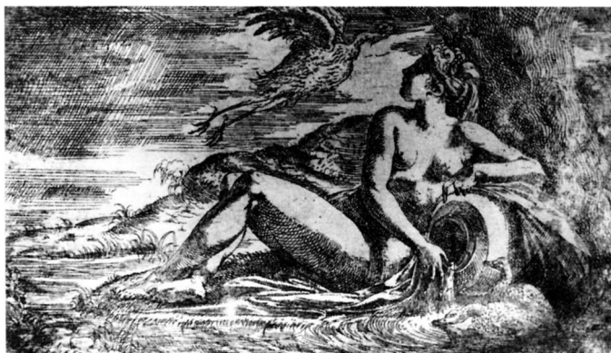
10.L. Thiry: Vodena Nimfa gleda čaplju, grafika

herojskih djela. Stvaralac "libreta" za zidne slike s "literarnom" slobodom i znalačkom sigurnosti barata sudbinama antičkih junaka i bogova. On dobro poznaje njihova, u humanističkoj filozofiji obrazložena simbolička značenja. U vodenoj Nimfi i močvarnoj ptici i mimo takve intelektualne pripreme može se prepoznati primjerena ilustracija kišovitoj i vlažnoj jesenjskoga godišnjeg doba.