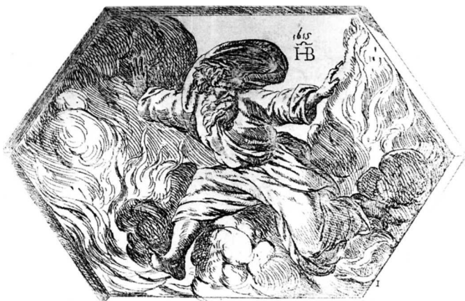
5. O. Borgiani: Bog dijeli svjetlo od tame, grafika po Rafaelu

Opisujući arhitekturu ljetnikovca, odnos prema krajoliku i metaforična značenja koja sadrži taj odnos, spomenuo sam i naslikani prizor na svodu i njegov važan udio u ideji predstavljenoj ljetnikovcem 14 . Za takvo razmatranje dostajala je datacija slike u 18. stoljeće i tumačenje njezine tematike u kojoj se poistovjećuje red svijeta ostvaren Zeusovom pobjedom nad Giganatima s poretkom koji arhitektura ljetnikovca unosi u prirodni krajolik. Pitanje likovnog reda u slici i njegova porijekla nije se postavljalo. Pokušajmo odgovoriti bar na dio takva pitanja.