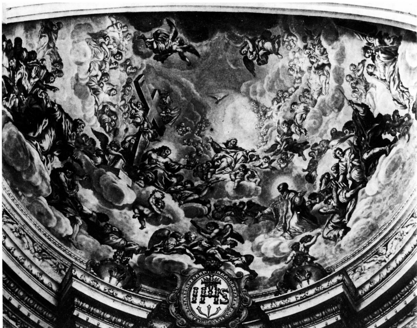
1. G. Garcija: Sv. Ignacije u nebeskoj slavi, Isusovačka crkva, Dubrovnik

na svod dubrovačke crkve. Stoga je uslijedio zaključak da su dubrovački isusovci odredili Garciji zadatak na temelju Ferrijevih pripremnih kartona po kojima je radio zidnu sliku 2 . Pretpostavka se potvrdila - ali na sljedeći način. Ciro Ferri godine 1670. u Rimu potpisao je ugovor s obitelji Pamphili, kojim se obvezuje oslikati svod kupole u crkvi S. Agnese in Agone. Radove je trebao dovršiti za četiri godine. Njegov prvi prijedlog naručitelji nisu prihvatili, premda je, po mišljenju Beatrice Canestro Chioveda, autorice studije iz koje navodimo ove podatke, "kompozicija bila mirnija i jednostavnija od one kasnije, jer nije imala pretjeranih vrtloženja niti gomilanja likova" 3 . Prihvaćen Ferrijev prijedlog temelji se - kako je to već dobro poznato - na zidnim slikama Pietra da Cortone iz kupole i apsidalnoga svoda rimske crkve S. Maria in Vallicella.