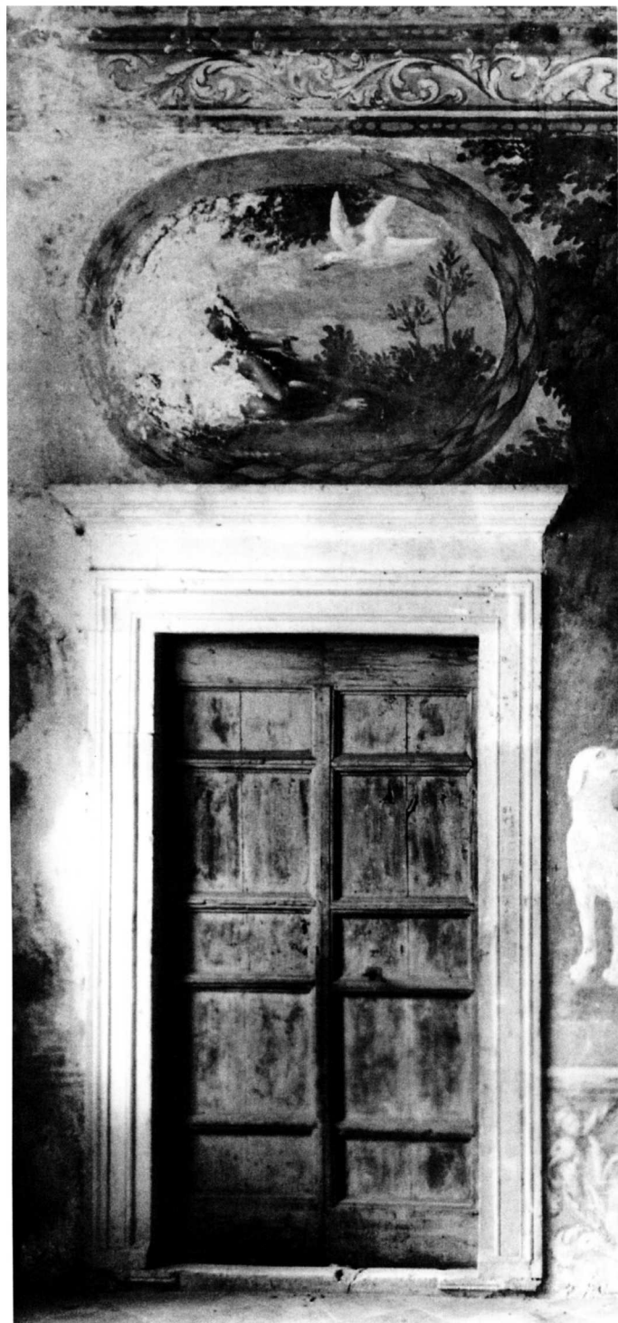
9. Alegorija jeseni, Sorkočevićev ljetnikovac u Rijeci dubrovačkoj