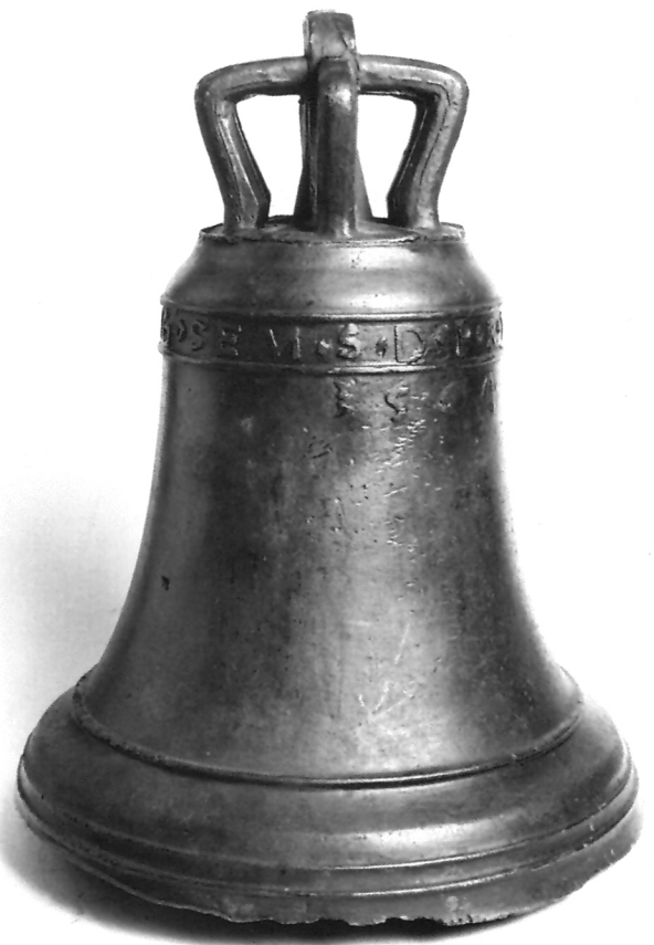
3. Zvono iz kapele sv. Vida u Samoboru, 1564. godina