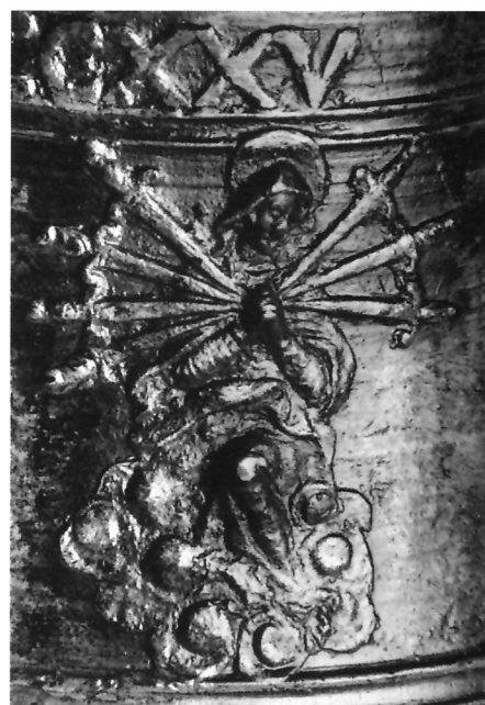
5b. Detalj zvona de Polisa, Bogorodica od sedam žalosti