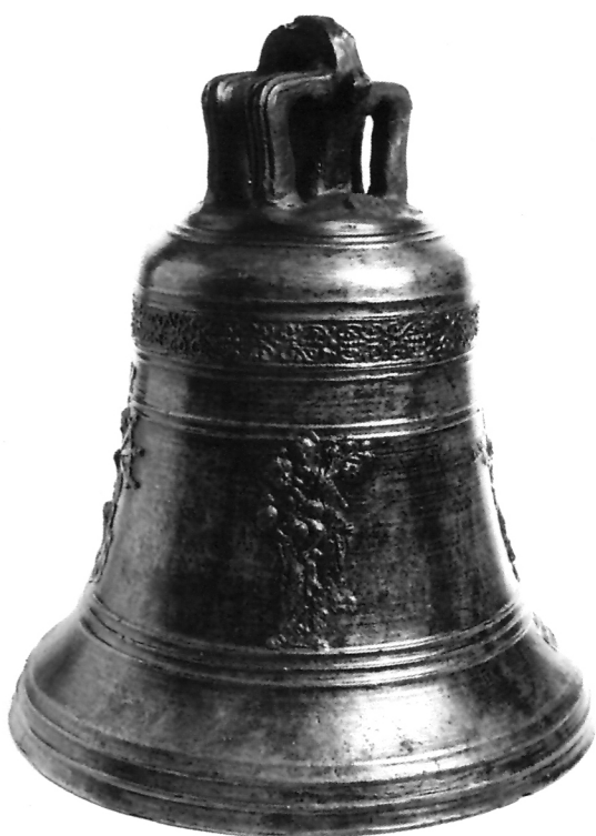
5. Zvono majstora Pavle de Polisa iz 1725. godine