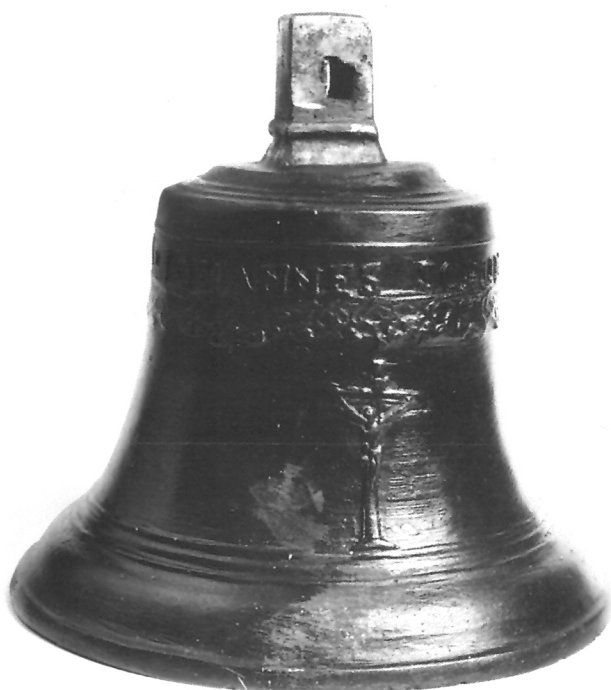
8. Zvono varaždinskog majstora Antona Fiel iz 1839. godine