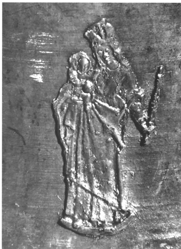
6a. Detalj zagrebačkog zvona, Bogorodica s Kristom