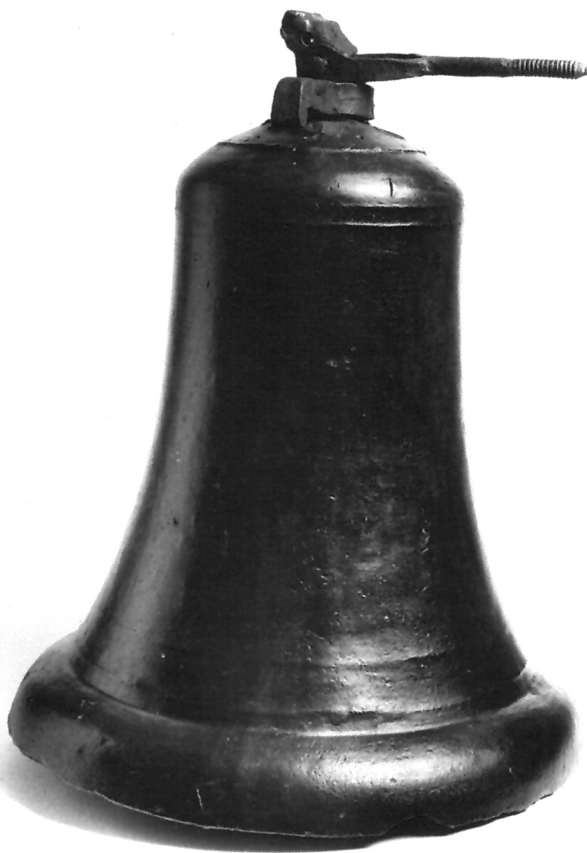
1. Kasnogotičko zvono, kraj 14., početak 15. stoljeća