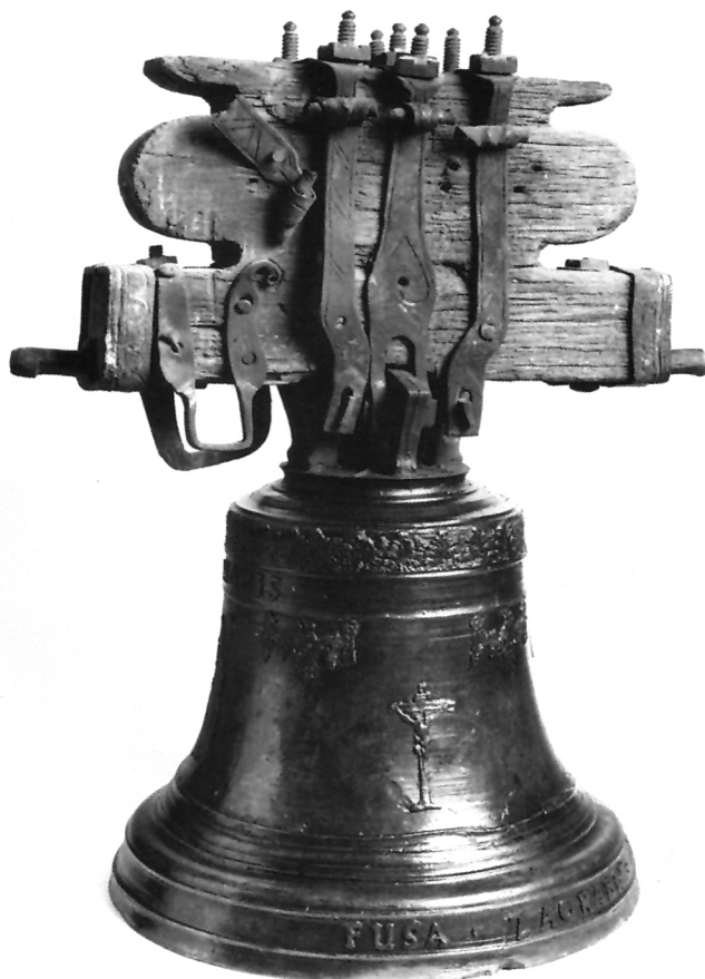
6. Zvono nepoznatog majstora izliveno u Zagrebu 1742. godine