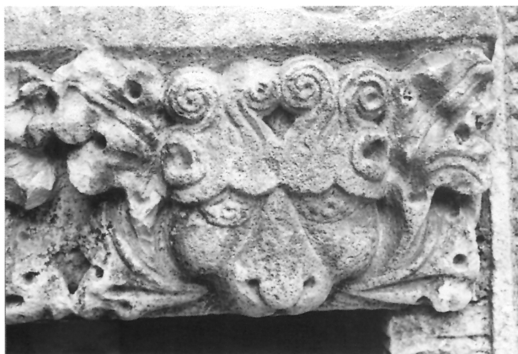
1. Motiv lavlje glave s listovima na umivaoniku pored glavnih gradskih vrata u Hvaru