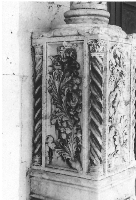
3. Podnožje sjevernog stupa zapadnog pročelja šibenske katedrale