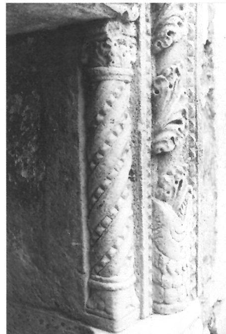
4. Baza okvira umivaonika kraj glavnih gradskih vrata u Hvaru