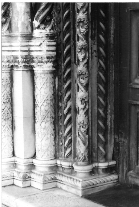
2. Unutrašnji okvir sjevernog pročelja šibenske katedrale