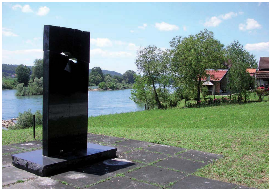
01 – Spomen obilježje mjesta masovne grobnice žrtava iz Domovinskog rata Skelište u Baćinu/Hrvatska Dubica

Do danas je u hrvatskom Pounju otkriveno 11 masovnih grobnica, koje su nastale u periodu 1991. – 1993., s ukupno 114 žrtava, od čega 15 neidentificiranih.