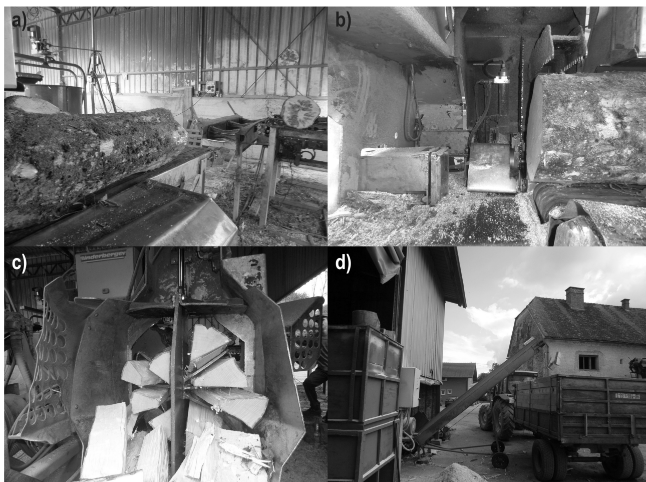
Slika 1. Radni zahvati pri izradi kratko rezanoga i cijepanoga ogrjevnoga drva: a) transport obloga energijskoga drva do mjesta prerezivanja; b) prerezivanje; c) cijepanje; d) transport kratko rezanoga i cijepanoga ogrjevnoga drva

Fig 1 Work elements in chopped firewood production: a) transport of round fuelwood to the place of cross-cutting; b) cross-cutting; c) splitting; d) transport of chopped firewood