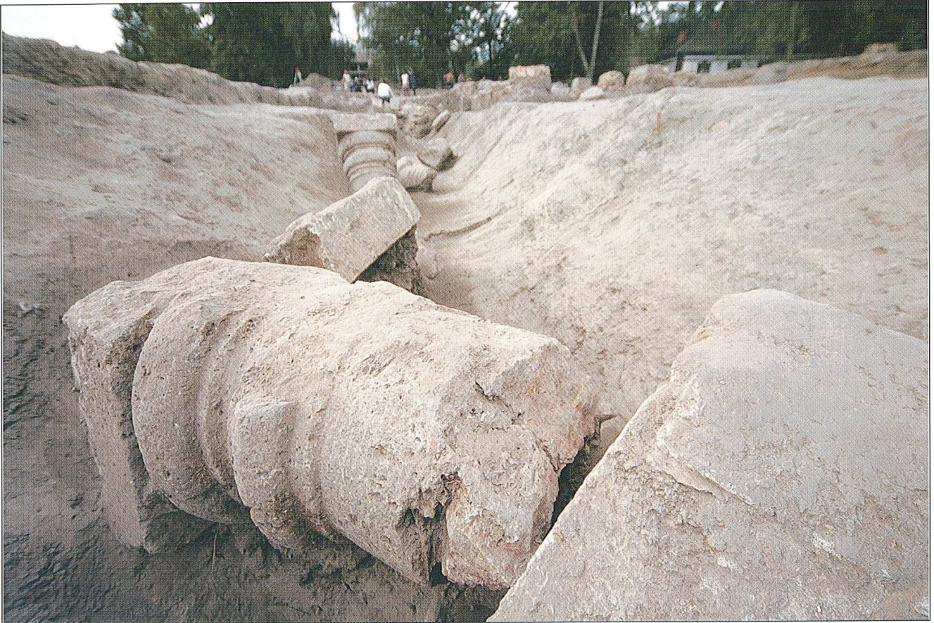
OS-V-PF, južni odvodni kanal