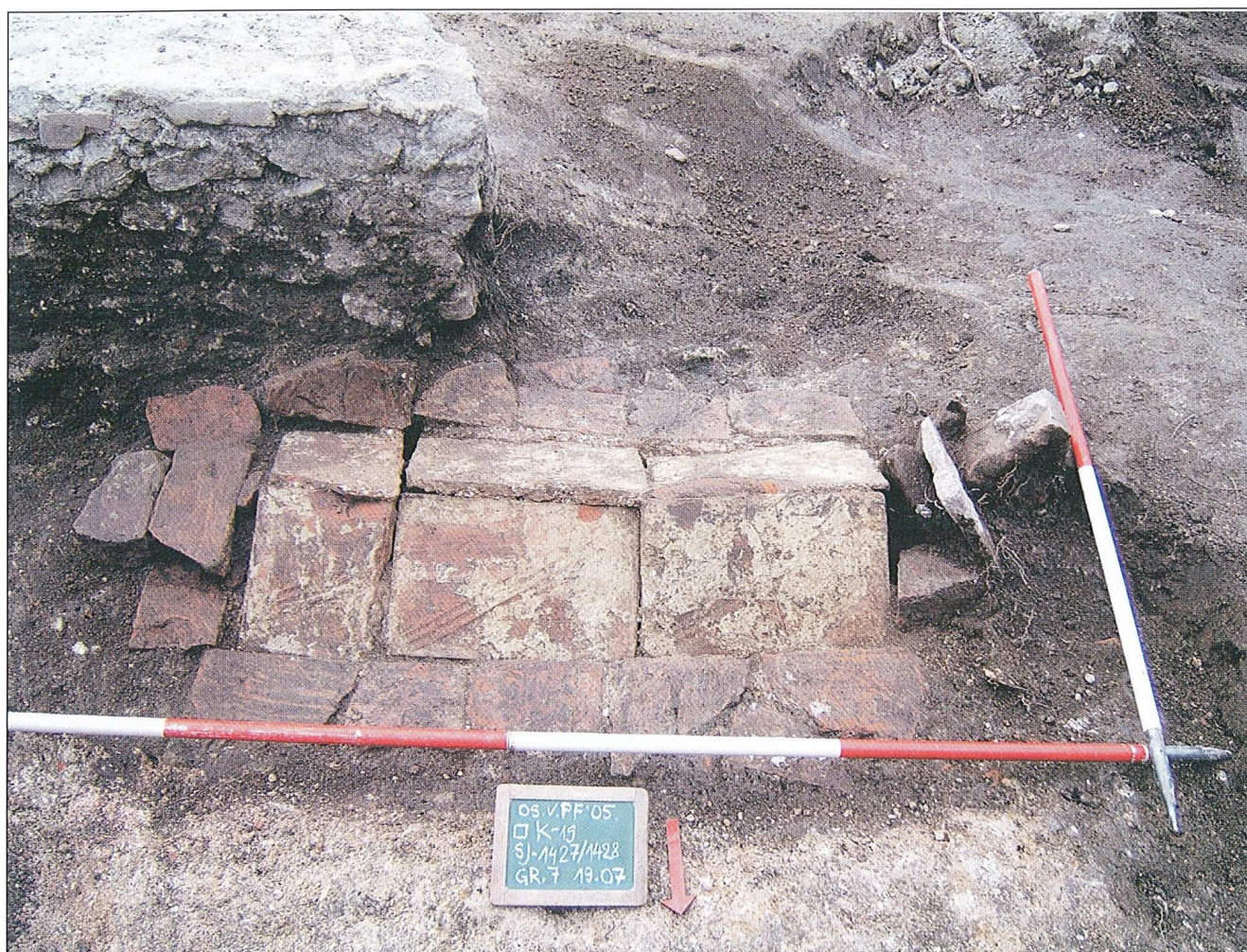
OS-V-PF, grob 7, foto: S. Filipović