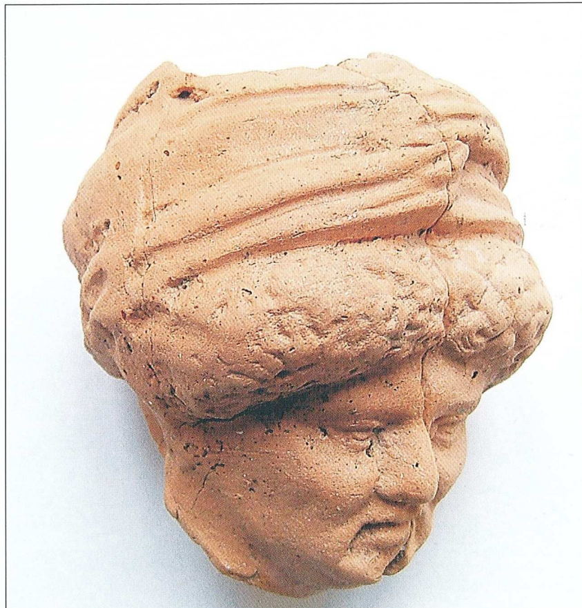
OS-V-PF, glava terakotne figure, foto: M. Romulić