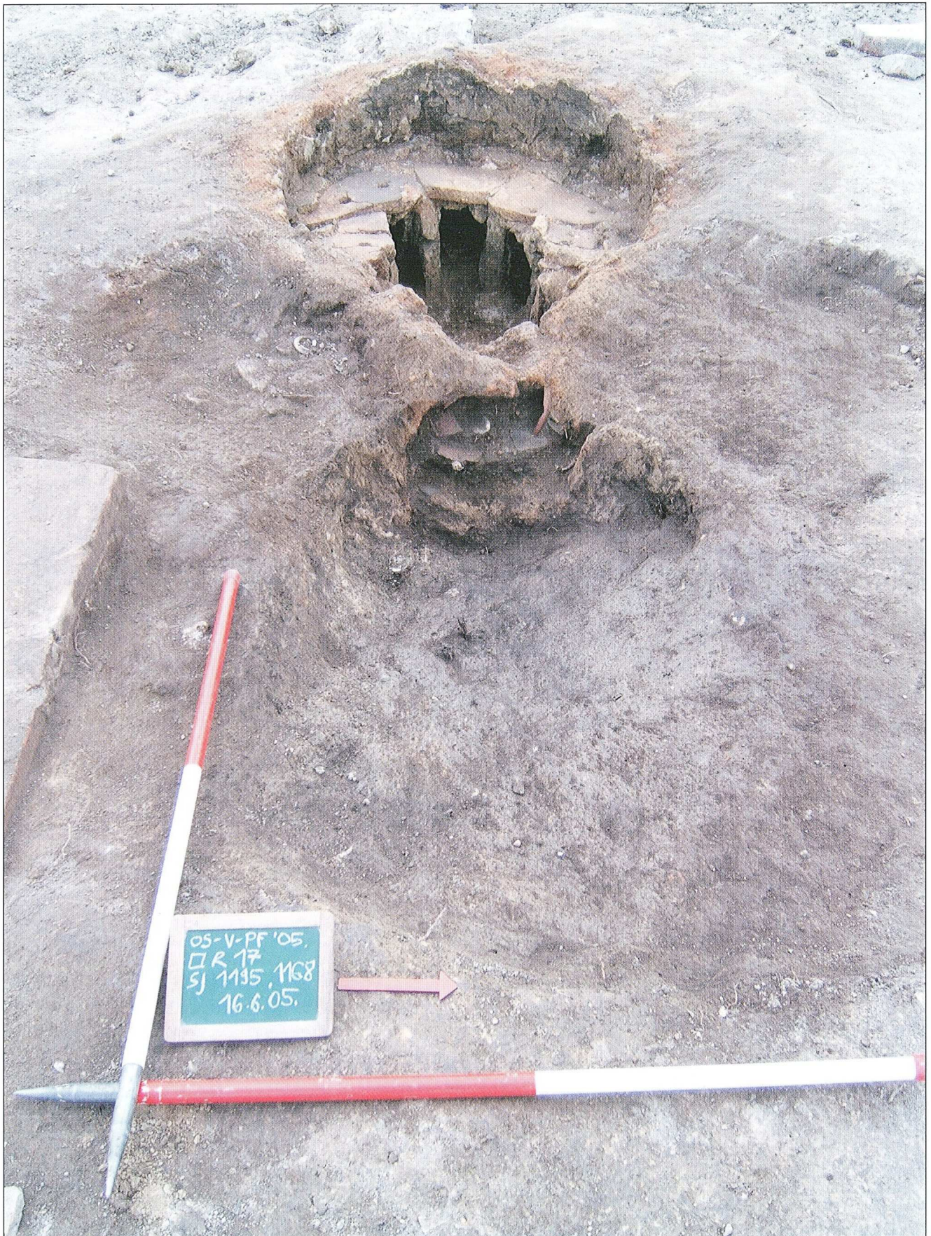
OS-V-PF, keramičarska peć