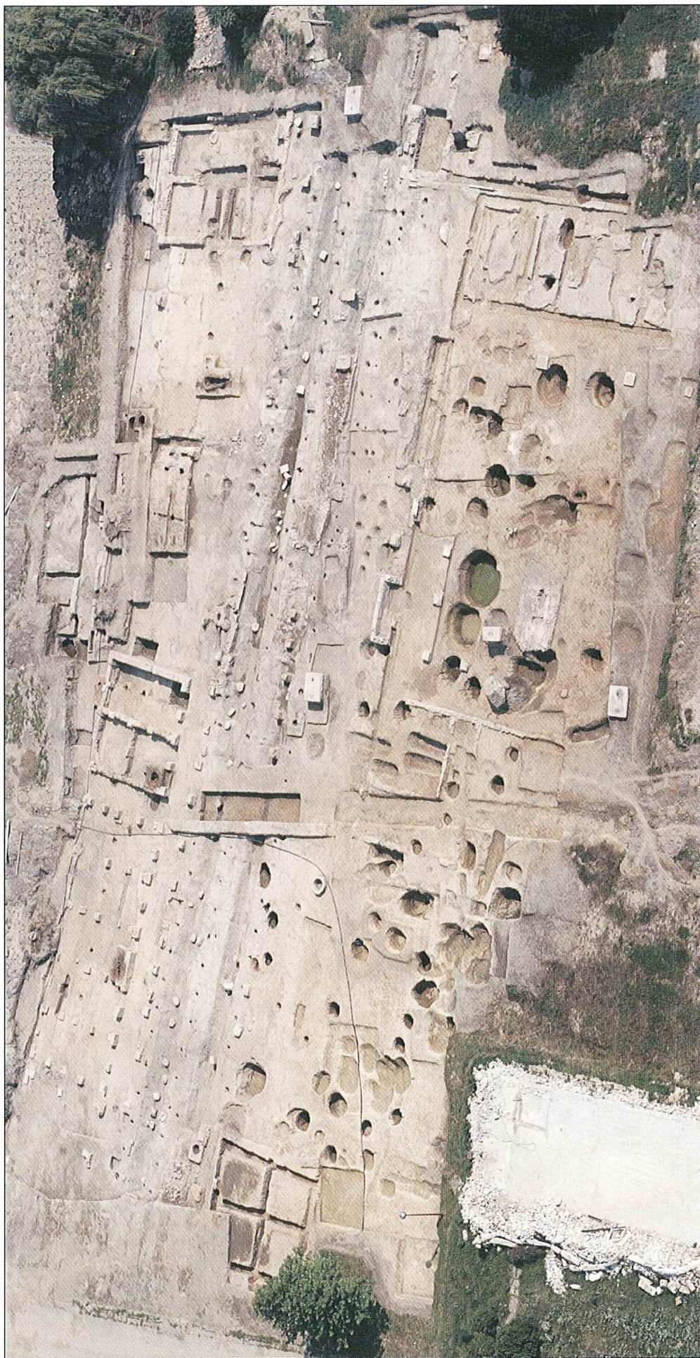
OS-V-PF, aerostimik terena, foto: M. Romulić