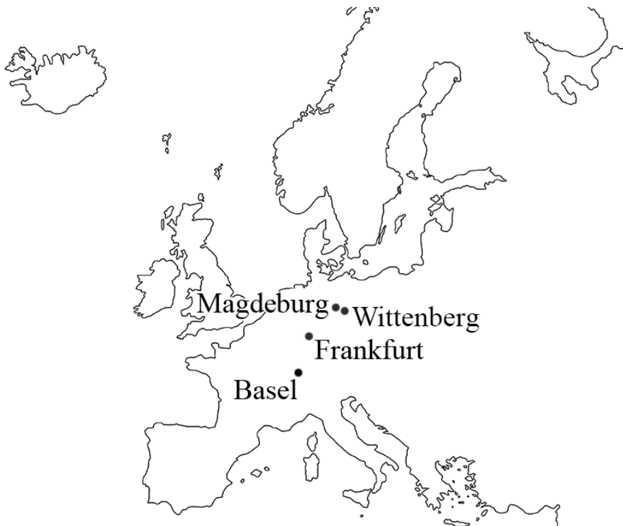
Slika 3. Zemljovid Europe s protestantskim tiskarskim središtima u kojima su tiskana Vlačićeva djela (1548–1552).

dok je po Pregerovoj bibliografiji 1551. 1 Godina 1551. poklapa se s godinom drugog izdanja istaknutom na naslovnici djela. Osim godine izdanja, u naslovima je vidljiva razlika u pismu. Rečenica »Durch Matthiam Flacium Illyricum« koja se nalazi na naslovnici iznad navoda iz Poslanice Galaćanima u prvom primjeru otisnuta je njemačkom goticom, dok je u drugom otisnuta latinicom.