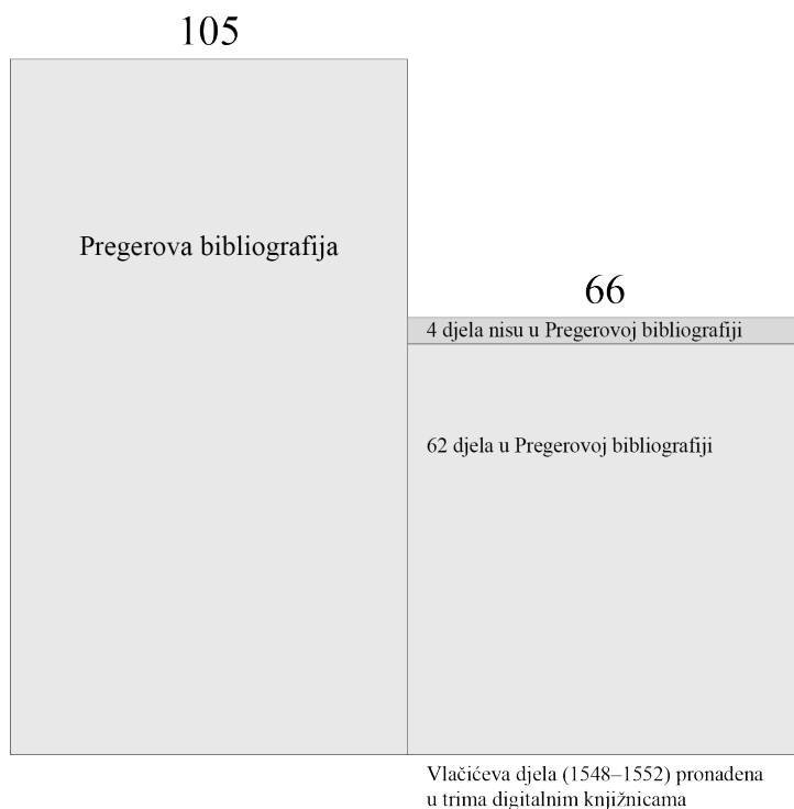
Slika 5. Grafički prikaz kvantitativne usporedbe pronađenih Vlačićevih digitaliziranih djela (1548–1552) s Pregerovom bibliografijom.

Nakon usporedbe pronađenih djela s Pregerovim popisom iz 1861. koji sadrži 105 bibliografskih jedinica za promatrano razdoblje, utvrđeno je da 62 pronađena djela odgovaraju bibliografskim jedinicama s Pregerova popisa (slika 5).