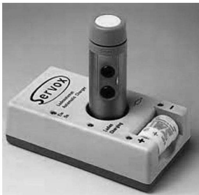
Slike 4 i 5.