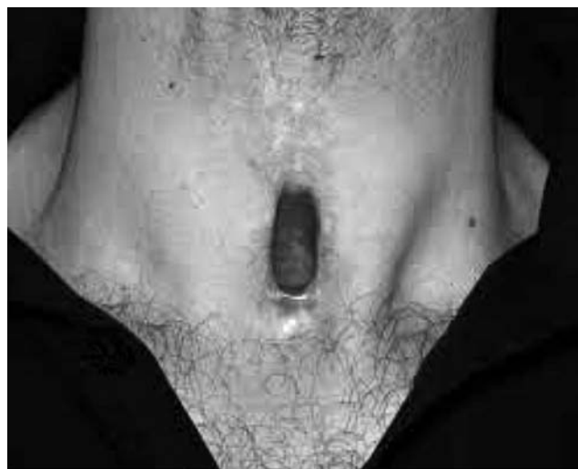
Slika 1: Traheostoma

Traheostoma je otvor na vratu u kojem je dušnik direktno sašiven za kožu. Nakon učinjene laringektomije bolesnik više ne diše na nos nego na traheostomu. Kod pacijenata kod kojih je učinjena totalna laringektomija, definitivna je i ostaje cijeli život. Gutanje se odvija prirodnim putem, a kako su obje glasnice odstranjene onemogućen je govor prirodnim načinom. Prvu uspješnu laringektomiju na bolesniku izveo je kirurg Billroth 1873. u Beču. (1)