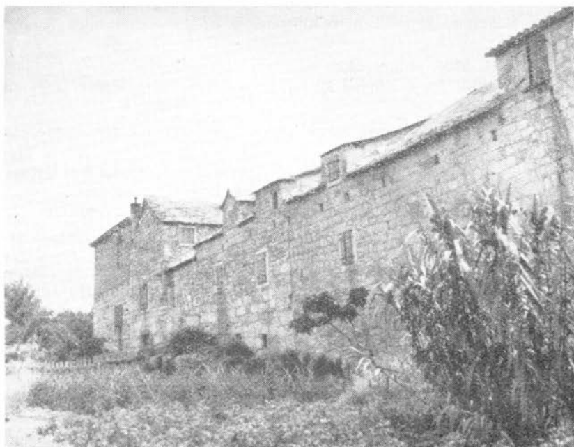
6. Paraćev dvor u Solinu

Sklop kuća, koji sastavlja Paraćev dvor daje sliku prave tvrđave. I on je sagrađen kamenjem s amfiteatra, a ima i uzidanih spolia,