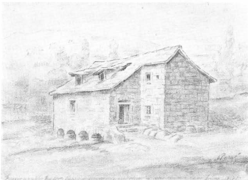
3. Gabrićeva velika mlinica u Solinu (Crtež Vj. Paraća)

U XVI. stoljeću posjedovala je »Veliku Galiju« sa petnaest mlinova udovica silnoga Rustem-paše. Ta je mlinica upala u oko i danskomu prirodoslovcu Brünnich-u, koji piše, da su ti mlinovi od kremena.