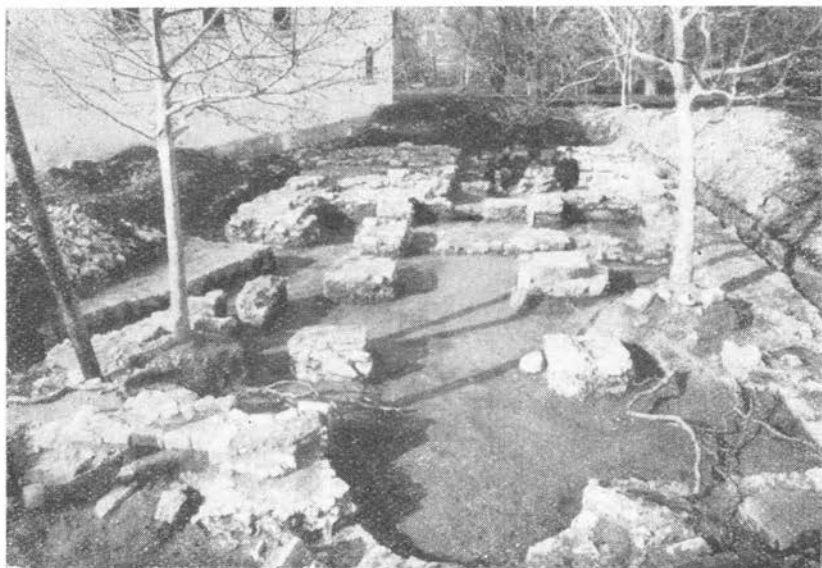
2. Temelji Gospe od Otoka. Sarkofag Jelenin naden je u desnom gornjem uglu

On, dakle, prihvaća Vasićevo mišljenje, da je crkva s Jeleninom grobnicom imala dva predvorja (narteks i atrium), u čemu i Vasić vidi utjecaj Bizanta. Karaman je ubraja među starohrvatske bazi-