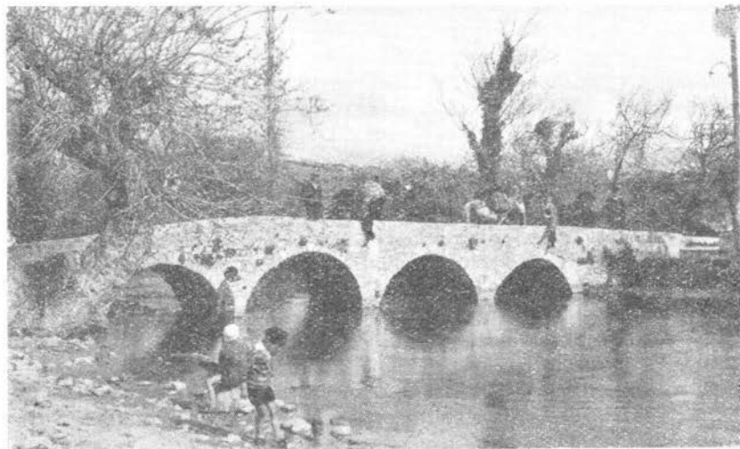
4. Most kod Otoka u Solinu

preko rijeke bio je na Gospinu Otoku. Kod Velike Galije do pred posljednji rat postojao je rimski most 9 m dug, 1,85 m širok s dva luka (svaki 2,60 m širok). Lukovi su bili polukružni i ležali na jakom podnožju, koje je oštrim kljunom razbijalo vodu, što je padala s obližnjeg slapa. Odatle je vodio put preko mostića ispred Velike Galije na Gospin Otok. Naravno, da je na toj točki mlinica morala biti dobro utvrđena, kako je već spomenuto, a godine 1567. bilježi Mlečanin Antonio Pasqualigo: »una casa fabricata in volto con XII. rote de molini«. 65)