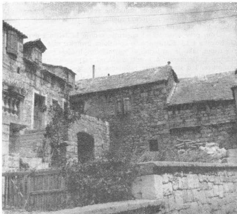
7. Dvorište Paraćeva dvora

Njegovu novu povijest treba posebno obraditi, što ne spada u okvir ove radnje, koja se većim dijelom oslanja na kamene i arhivske izvore.