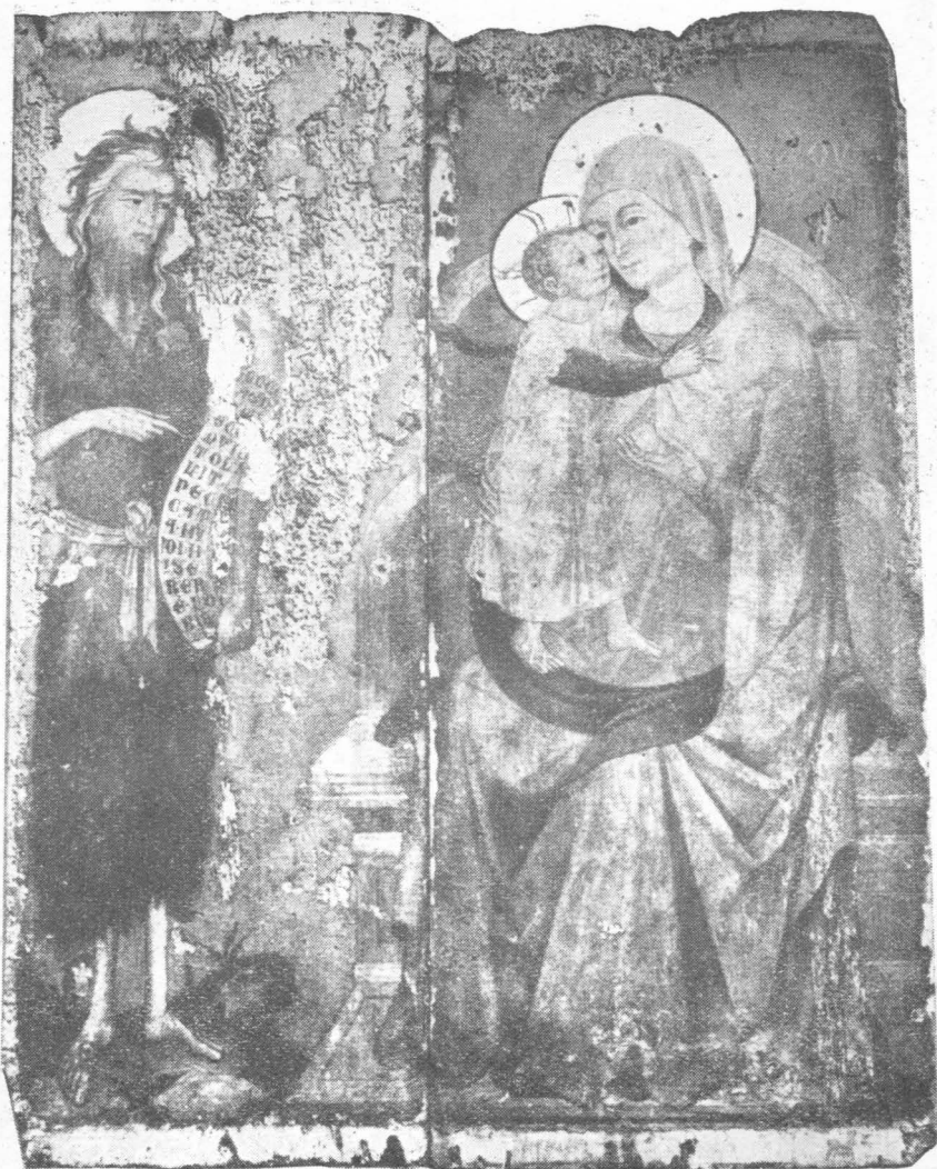
32. Gospa i sv. Ivan iz franjevačkog samostana u Kraju na Pašmanu