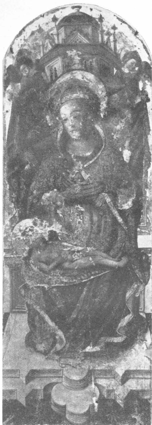
37. Marija na prijestolju u župnoj crkvi Tkona na Pašmanu.