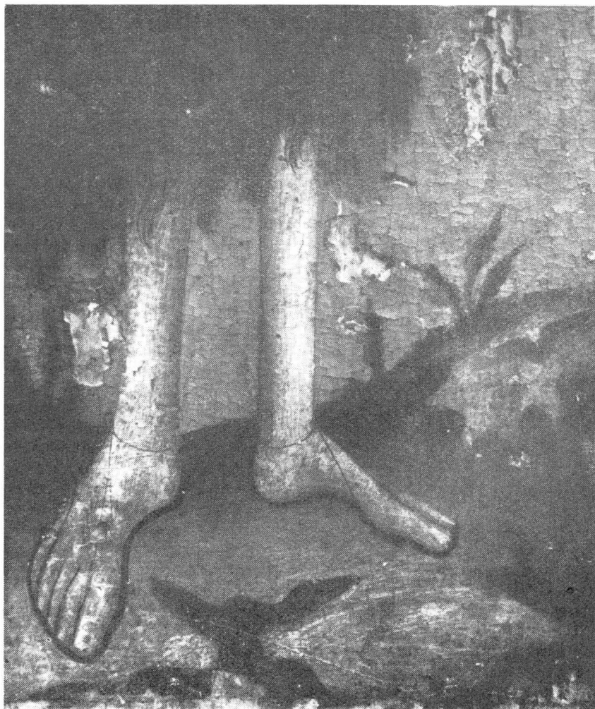
34. Detalj Ivanove slike u Kraju na Pašmanu

plašta. Majka ga desnom rukom drži oko struka, a lijevom mu pruža okrugli plod (jabuku, ili vjerojatnije naranču).