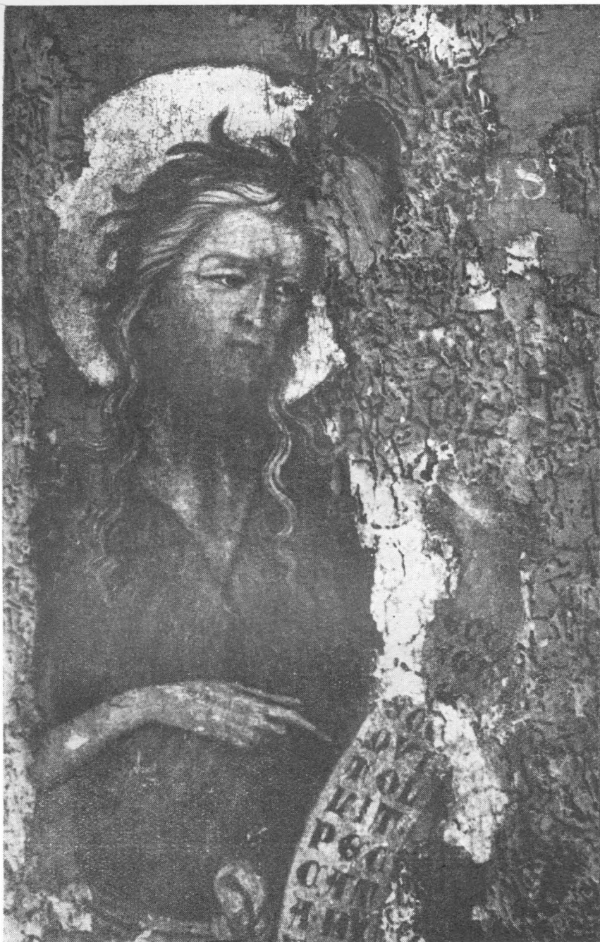
33. Detalj slike u Kraju na Pašmanu