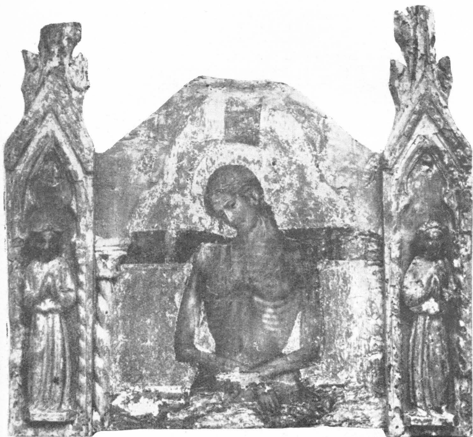
35. Ulomak poliptiha iz Luke na Dugom Otoku

AC LVCAS FILIVS) god. 1564. 8) Centralni dio pale se sastoji od starijeg triptiha, domaće škole XV. st. Lica Madone, malog Krista i svetaca na krilima potsjećaju nas na fiziognomije pašmanskih svetaca, a po fotografiji slike sv. Mateja s lijevog krila, koja je snimljena kad se sa slike skinuo okov 9) vidi se mnogo detalja sličnih pašmanskim slikama: crvena pozadina, meka modelacija nabora, zlatne aureole crno obrubljene, veoma slična modelacija ruku. Nisam bio još u mogućnosti da sam skinem okov i proučim slike, tako da ne mogu tvrditi da su one toliko srodne pašmanskima, koliko su pašmanske srodne međusobno.