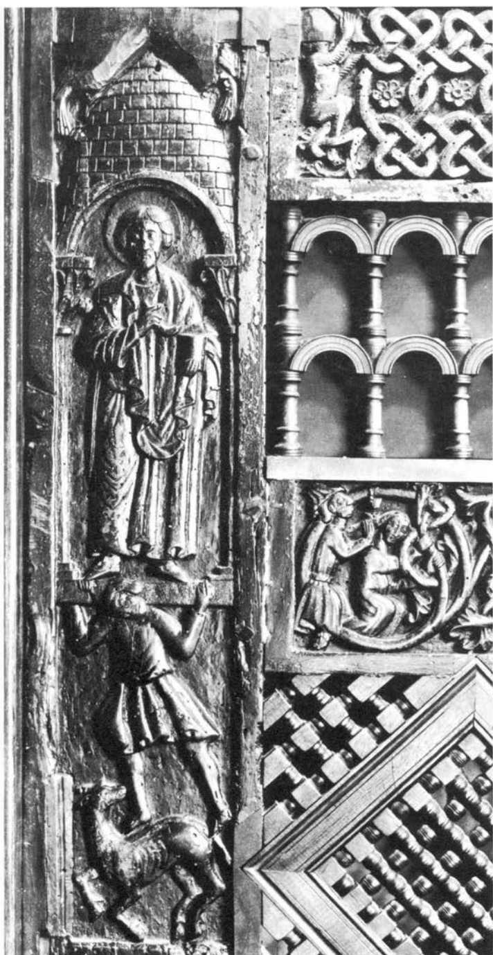
Sv. Damjan i pauanovi na ciboriju