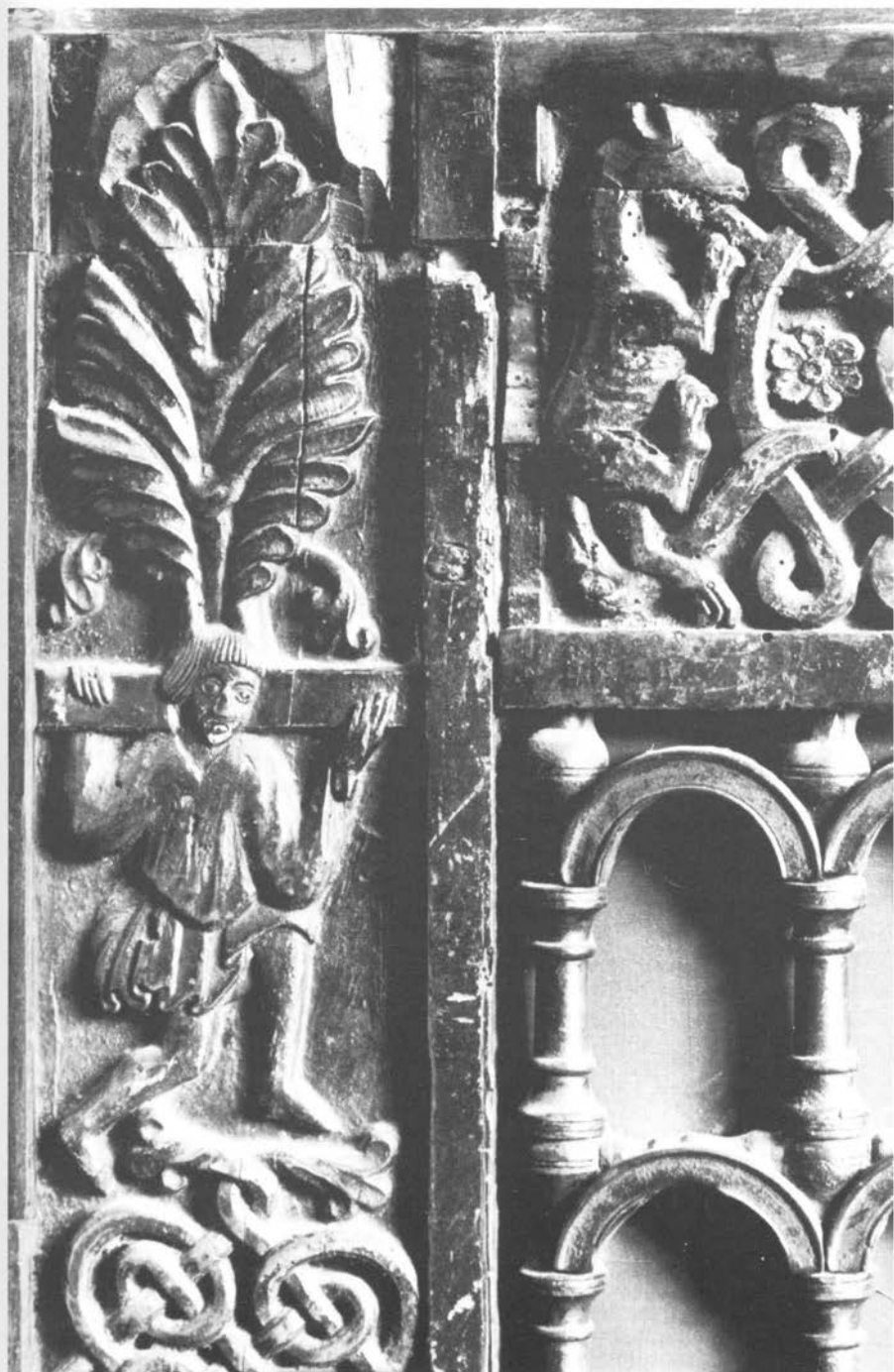
Telamon koji nosi palmu