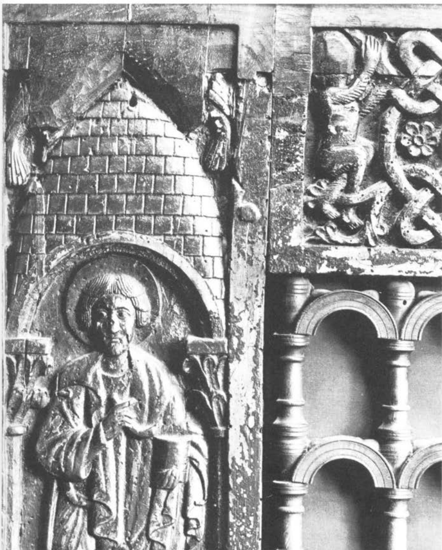
Satir u lozici

lice, uokvireno skraćenom kosom, i plosnata desnica odava mirno i pobožno pjevanje psalama koji se uza to srednjovjekovno glazbalo jevahu. Karaman je točno primijetio 37 da su ovdje prikazana najstarija srednjovjekovna glazbala kod nas i po njihovoj sličnosti s ostalim onovremenim u Evropi zaključio da se i kod nas na istim, kao i u evropskim krajevima